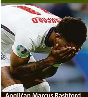
Angličan Marcus Rashford

Rowdies zhruba dvě hodiny před zápasem prolomili bezpečnostní bariéry v okolí stadionu a prali se mezi sebou i s pořadateli. Někteří se snažili proniknout na stadion. Policie tvrdí, že se nikdo bez lístku na tribuny nedostal, ale podle svědků malá skupinka příznivců načerno do hlediště Wembley pronikla. Mezi sedačkami je pak naháněla bezpečnostní služba.