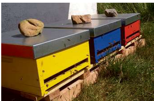
Areály PVK si oblíbily včely i vážky.

Od června mají PVK tři nová včelstva. Celkem je tak v areálech už 26 úlů! Kvetoucí louky na vodojemech poskytnou dostatek nektaru i pylu; a protože biotop na Floře nabízí i jezírko, nemusejí mít okolní obyvatelé strach, že by včely hledaly vodu na jejich zahradách či balkonech. Med z pražských vodojemů si zanedlouho můžete koupit na místních farmářských trzích.