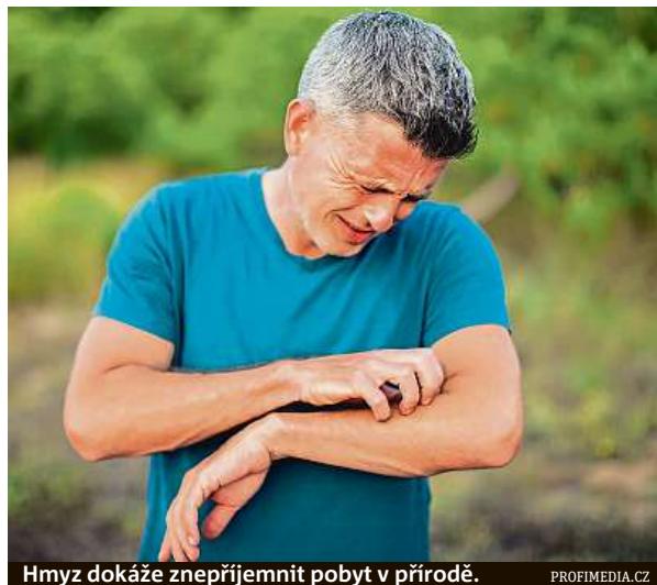
Hmyz dokáže znepříjemnit pobyt v přírodě.

Pokud alergik nejste a štípane vás vosy či včela, není důvod k panice. Postižené místo bolí a pálí, ale když zůstane jen u těchto příznaků, postačí lokální léčba. Nejlepší je studený obklad na místo vpichu, naše babičky pak doporučovaly cibuli nebo ocet. Lze použít také chladivý tekutý