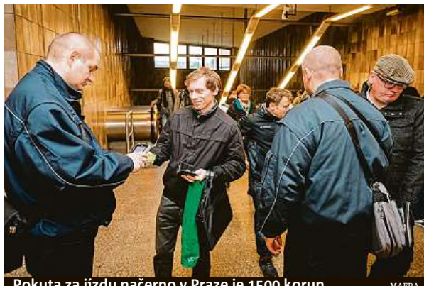
Pokuta za jízdu načerno v Praze je 1500 korun. MAIRA

Pokud vás revizor přistihl bez jízdního dokladu nebo doma, stačí navštívit web eshop.dpp.cz . Zde je poté nejpraktičtější zvolit možnost Pokuty, zadat číslo ze zápisu o provedené přepravní kontrole a následně pokutu uhradit on-line platební kartou. „Po-