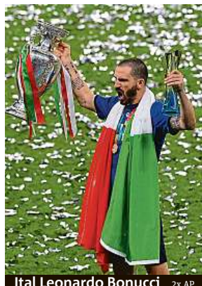
Ital Leonardo Bonucci 2x AP

Rowdies zhruba dvě hodiny před zápasem prolomili bezpečnostní bariéry v okolí stadionu a prali se mezi sebou i s pořadateli. Někteří se snažili proniknout na stadion. Policie tvrdí, že se nikdo bez lístku na tribuny nedostal, ale podle svědků malá skupinka příznivců načerno do hlediště Wembley pronikla. Mezi sedačkami je pak naháněla bezpečnostní služba.