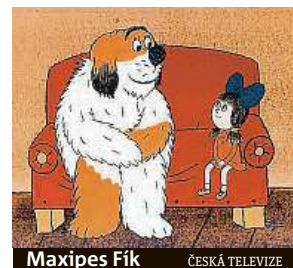
Maxipes Fík ČESKÁ TELEVIZE

Kořatost Šalamounova výtvarného jazyka i jednotlivé jeho fáze lze ve dvou patrech galerie Moderna Musea Kampa objevovat od 17. července do 30. září. MET