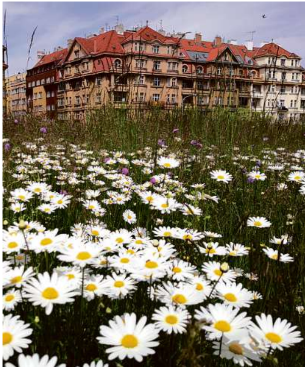
Na loukách ve vodárenských areálech kvetou kopretiny i třezalka.

Lidem se však neposečená tráva často nelíbí, nízký trávník je brán jako důkaz, že se o něj dobře pečuje; vysoký porost jim připadá neupravený a vadí jim také zdravotní rizika, především pylové alergie. Otázka kosení a údržby