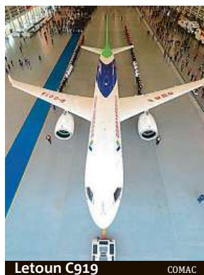
Letoun C919 COMAC

Premiéru v komerčním provozu by měl letoun C919 letos absolvovat v barvách čínské letecké společnosti China Eastern Airlines. Ta si jich v březnu objednala cel-