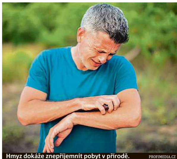
Hmyz dokáže znepříjemnit pobyt v přírodě.

Pokud alergik nejste a štípane vás vosy či včela, není důvod k panice. Postižené místo bolí a pálí, ale když zůstane jen u těchto příznaků, postačí lokální léčba. Nejlepší je studený obklad na místo vpichu, naše babičky pak doporučovaly cibuli nebo ocet. Lze použít také chladivý tekutý