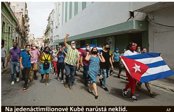
Na jedenáctimilionové Kubě narůstá neklid.