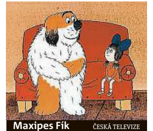
Maxipes Fík ČESKÁ TELEVIZE

Košatost Šalamounova výtvarného jazyka i jednotlivé jeho fáze lze ve dvou patrech galerie Moderna Musea Kampa objevovat od 17. července do 30. září. MET