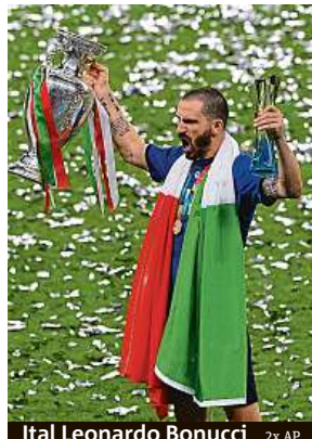
Ital Leonardo Bonucci 2x AP

Rowdies zhruba dvě hodiny před zápasem prolomili bezpečnostní bariéry v okolí stadionu a prali se mezi sebou i s pořadateli. Někteří se snažili proniknout na stadion. Policie tvrdí, že se nikdo bez lístku na tribuny nedostal, ale podle svědků malá skupinka příznivců načerno do hlediště Wembley pronikla. Mezi sedačkami je pak naháněla bezpečnostní služba.