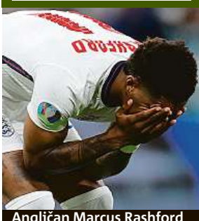
Angličan Marcus Rashford

Rowdies zhruba dvě hodiny před zápasem prolomili bezpečnostní bariéry v okolí stadionu a prali se mezi sebou i s pořadateli. Někteří se snažili proniknout na stadion. Policie tvrdí, že se nikdo bez lístku na tribuny nedostal, ale podle svědků malá skupinka příznivců načerno do hlediště Wembley pronikla. Mezi sedačkami je pak naháněla bezpečnostní služba.