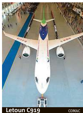
Letoun C919 COMAC

Premiéru v komerčním provozu by měl letoun C919 letos absolvovat v barvách čínské letecké společnosti China Eastern Airlines. Ta si jich v březnu objednala cel-