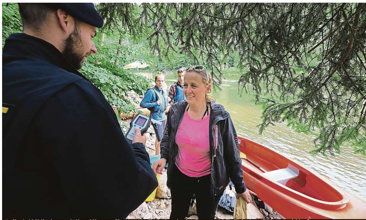
Policejní hlídky kontrolují vodáky na přítomnost alkoholu v krvi. Včera na Ohři všichni prošli bez problémů.

Kritický den. Lidé kvůli pověrčivosti odkládají operace nebo svatby. Číslo 13. Hotely nemají třináctá patra, v letadlech chybí řada s tímto prvočíslem. Loterie. Štěstí v tento den pokoušejí i ti, co jindy nesázejí STRANA 4