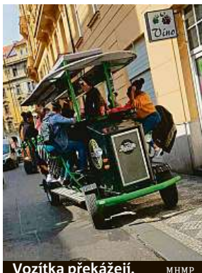
Vozítka překážejí. MHP

Pivní kola blokují centrum a vozí řvoucí opilce. Strážníci rozdávají desítky pokut.