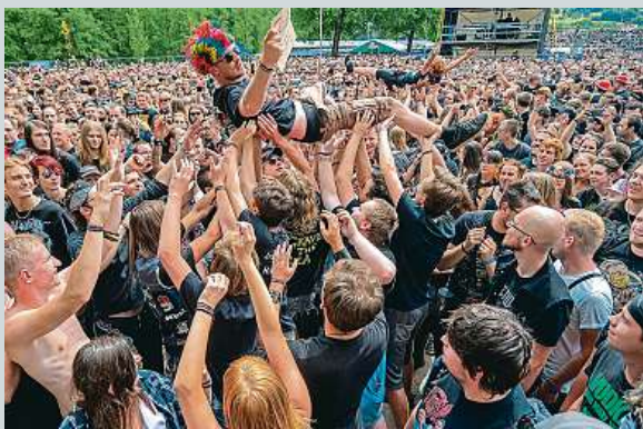
Atmosféra na Rock of Masters