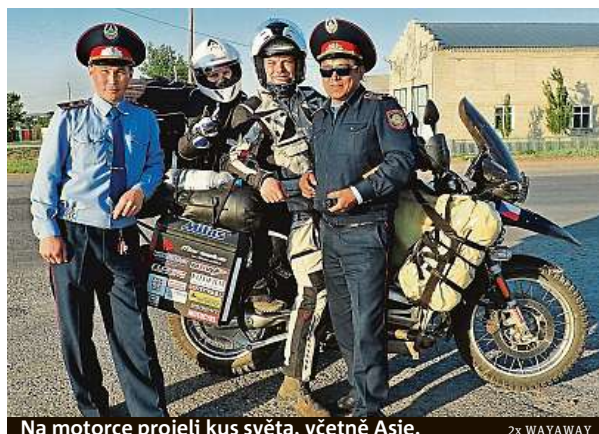
Na motorce projeli kus světa, včetně Asie.