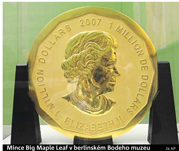
Mince Big Maple Leaf v berlínském Bodeho muzeu

Podoba dvojice zadržených podle policie odpovídá dvěma osobám, které v době krádeže zaznamenaly bezpečnostní kamery. Kriminálisté nahrávky zveřejnili před týdnem, na snímcích je černě oděná trojice, která své tváře skrývá pod kapucemi a zvednutými límci.