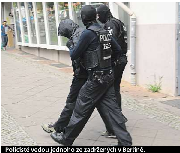
Policisté vedou jednoho ze zadržených v Berlíně.

Mince má průměr 53 centimetrů a tloušťku tři centimetry. Ačkoli má nominální hodnotu milion kanadských dolarů, podle listu Die Welt by se její tržní cena mohla jen na