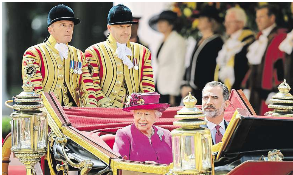
Na projížďce s Alžbětou II. Španělský král Filip VI. vyrazil na třídení návštěvu Velké Británie.

47 korun. Tolik v obchodech průměrně stojí čtvrtka másla. Velký skok. Oproti loňskému roku podražilo skoro o polovinu. Důvody. Kravského mléka je nedostatek i kvůli suchu, jeho cena proto stoupá STRANA 2