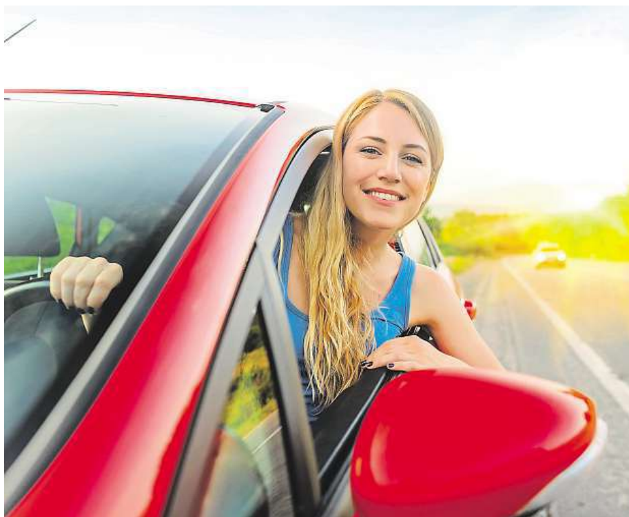
Pokud se na cestu dobře připravíte, máte větší šanci, že bude vše v pořádku.

A jak připravit auto na cestu plnou úskalí a co všechno zkontrolovat? Včasnou kontrolu vozidla a pravidelný ser-