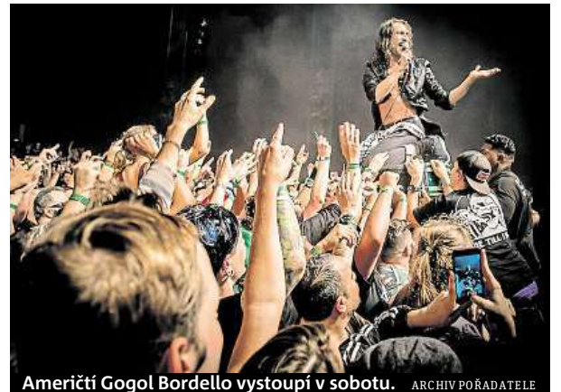
Američtí Gogol Bordello vystoupí v sobotu.

Postarají se o ně mimo jiné Gogol Bordello, Dubioza Kolektiv, Agnostic Front, H2O, The Adicts, Acidez, Ignite, Jaya The Cat, Cock Sparrer, domácí scénu budou reprezentovat Hentai Corporation, Sto zvířat, Fast Food Orchestra a další. Stage Radia 1 letos ozdobí přítomnost kapely Petra Čtvrtníčka a Leoše Nohy Buzerant a dále třeba Jananas, Role nebo Kittchen. Letos poprvé se chystá i diskusní panel Otázka punku. Všechny informace o programu je už nyní možné nalézt