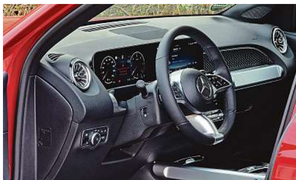
Volně stojící širokoúhlý kokpit se povedl, dobře se ovládá.