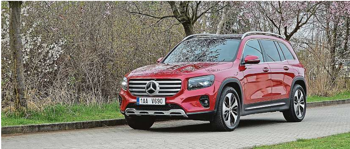
Jasně linie a výrazné proporce propůjčují modelu Mercedes-Benz GLB výrazný vzhled a offroadový charakter.