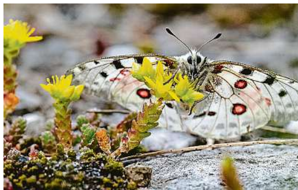
Ochránáři přírody vypustili v Krkonoších do volné přírody asi padesát jedinců kriticky ohroženého motýla jasoně červenoookého.