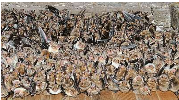
Svaz ochránců vyhlásil rok 2022 Rokem netopýřů. ČSOP

Letní mateřské kolonie chlupatých létavců nalezneme ve zhruba desetině tuzemských svatostánek.