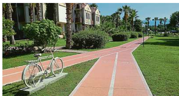
Mnohé hotelové resorty myslí na cyklisty i běžce.