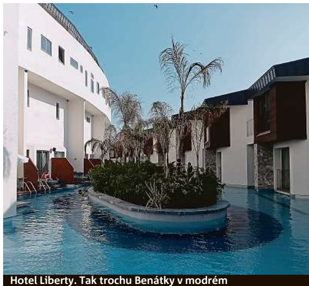
Hotel Liberty. Tak trochu Benátky v modrém