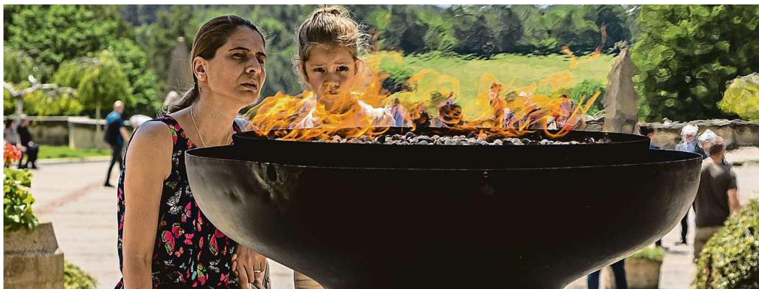
V Lidicích si včera přeživi i jejich potomci připomněli při pietní akci 80. výročí zničení obce nacisty.

Pečivo. Většina se ho prodává ve velkých prodejnách. Chléb. Má výhradně český původ a vlastníky STRANA 4