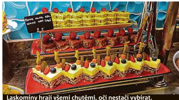
Laskominy hrají všemi chutěmi, oči nestačí vybírat.