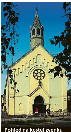
Pohled na kostel zvenku

Přestěhovat by se sem mohla ze zámku knihovna, vzniknout by tu mohla galerie. V současnosti se zpracovává projektová dokumentace na renovaci a využití celého kostela. „Pro realizaci bychom rádi využili dotační peníze,“ uvedla Oubrechtová.