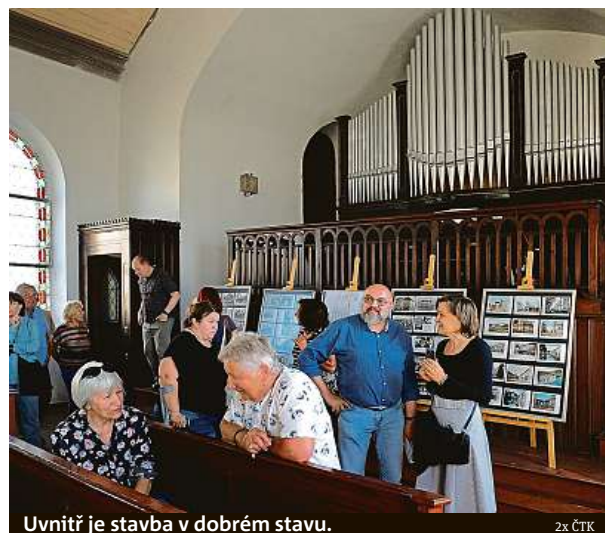
Uvnitř je stavba v dobrém stavu.