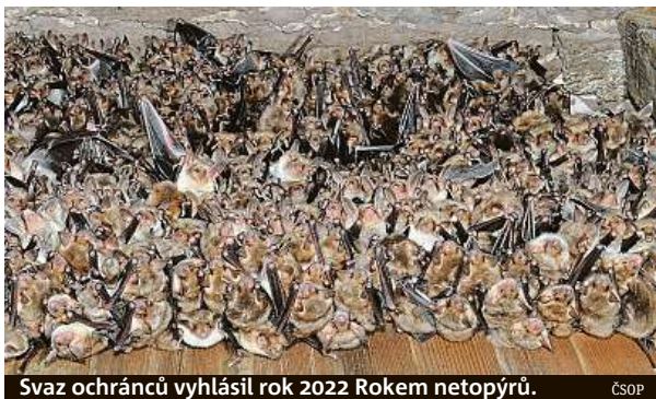
Svaz ochránců vyhlásil rok 2022 Rokem netopýřů. ČSOP

Na některých kostelních půdách se lze vzácně setkat