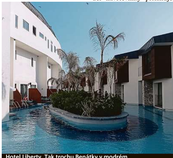
Hotel Liberty. Tak trochu Benátky v modrém