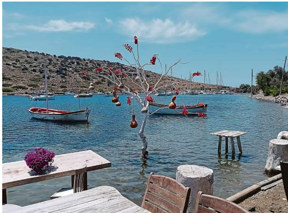
Stolování přímo ve vodě? I to najdete v Turecku.