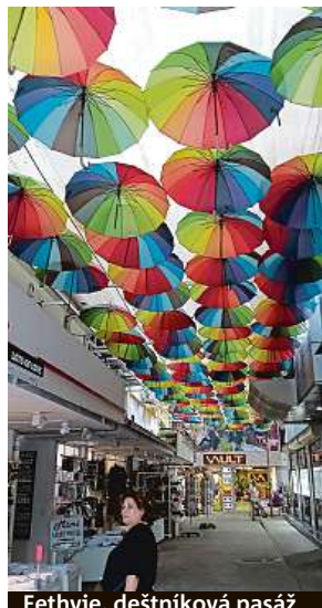
Fethiye, deštníková pasáž