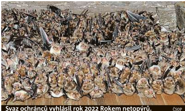
Svaz ochránců vyhlásil rok 2022 Rokem netopýřů. ČSOP

Na některých kostelních půdách se lze vzácně setkat