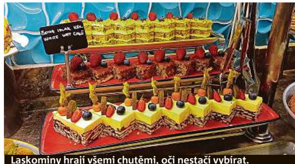
Laskominy hrají všemi chutěmi, oči nestačí vybírat.