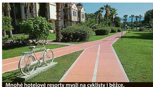
Mnohé hotelové resorty myslí na cyklisty i běžce.