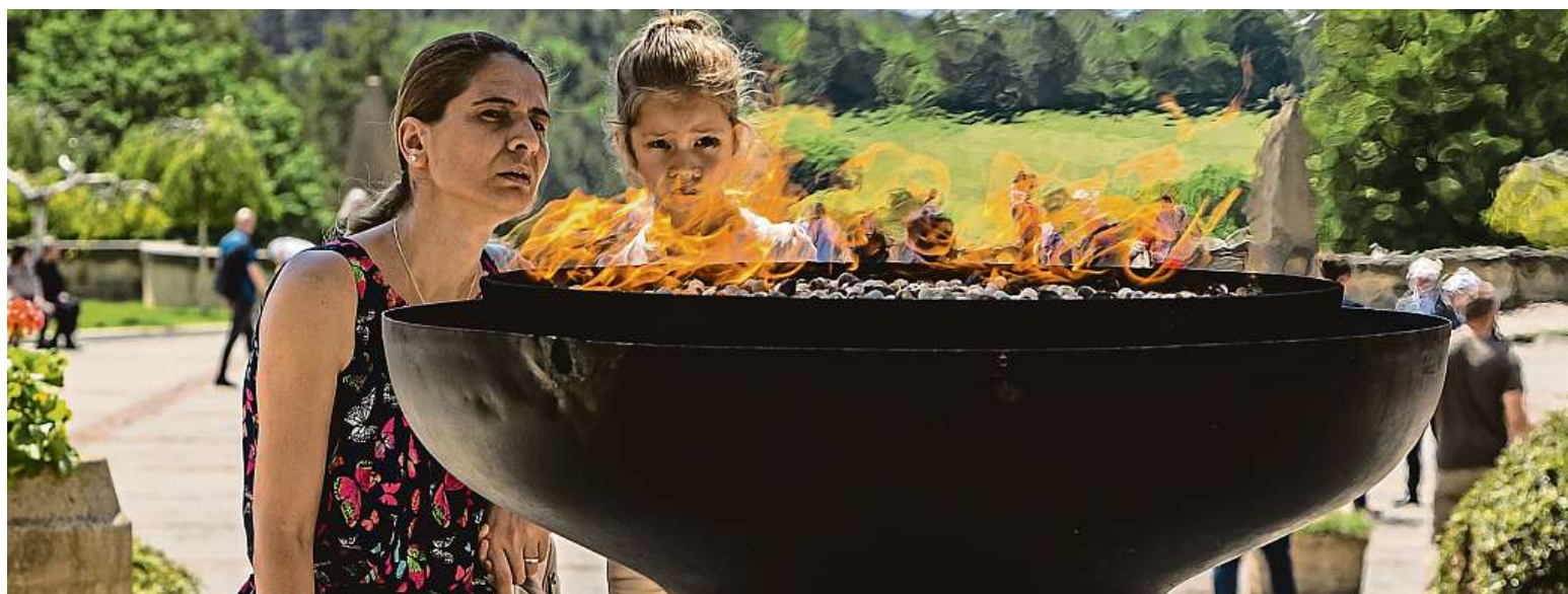
V Lidicích si včera přežívají i jejich potomci připomněli při pietní akci 80. výročí zničení obce nacisty.

Pečivo. Většina se ho prodává ve velkých prodejnách. Chléb. Má výhradně český původ a vlastníky STRANA 4