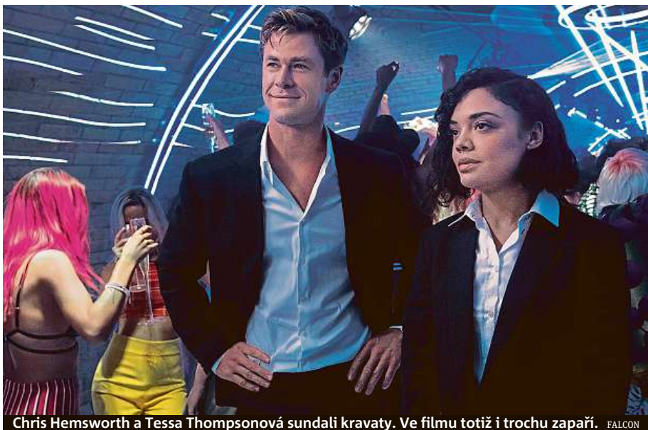
Chris Hemsworth a Tessa Thompsonová sundali kravaty. Ve filmu totiž i trochu zaparí.

Akční komedie o tajných agentech, kteří střeží Zemi před šmejdem z vesmíru, si vždy zakládala na humoru a i tentokrát vám budou při sledování cukat koutky. Však i tvůrci při výběru herců mysleli na to, že film má být sranda. Ač se to možná na první pohled nezdá, tak Chris Hemsworth (hraje britského agenta H) má komedii v krvi. Postava svůdníka, který nehraje podle pravidel, mu sedí skvěle. Arogantnímu hezounkovi dělá partnera nováček z americké centrály, kterého poslali kvůli „práci“ do Londýna. Zelenáčem je agentka M, kterou ztvárnila Tessa Thompsonová. Tahle dvojice už na plátně jednou mimo-