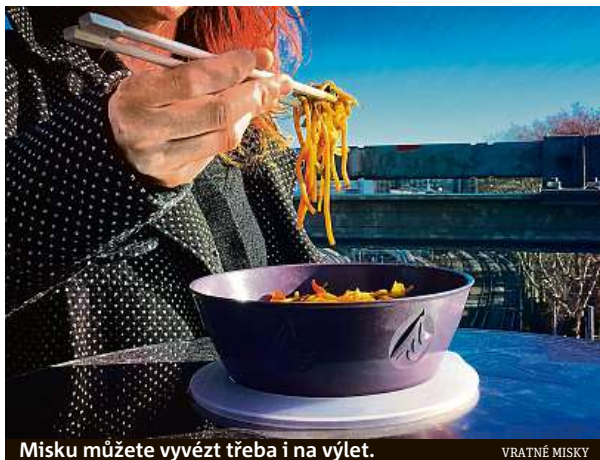
Misku můžete vyvézt třeba i na výlet.

Svou první vratnou misku s litrovým objemem si pořizují v holešovickém Baru Cobra, který je jedním ze čtyř pražských podniků, které se do projektu zatím zapojily. Na můj dotaz, zda je o misky zájem, mi odpovídá místní servírka. „Vzhledem k tomu,