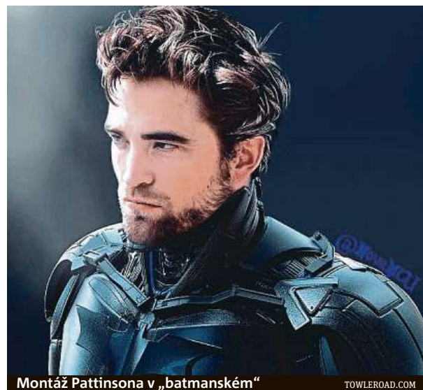
Montáž Pattinsona v „batmanském“

Asi nejvíce fanoušky historicky nejzatracovanějším představitelem filmového Batmana je herec George Clooney. Ten se za své pojetí této postavy ve filmu Batman a Robin z roku 1997 styděl tolik, že se za ni několikrát veřejně omluvil.