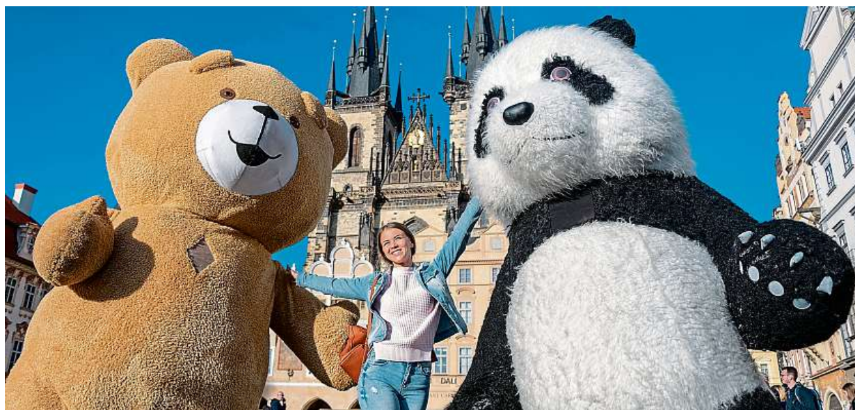
Už žádné pandy! Vedení města chce z ulic vyhnat kýčovitě atrakce. Více čtete na stran 5.

Životní styl. Chlubíme se hubnutím, přesto stále víc utrácíme za pochutiny, pivo a tvrdý alkohol. Bio jídlo. Jsme ochotni si za něj připlatit. Pivaři. Věrnost oblíbené značce je ta tam, když je zlatý mok ve slevě STRANA 9