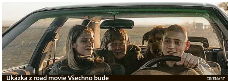
Ukázka z road movie Všechno bude