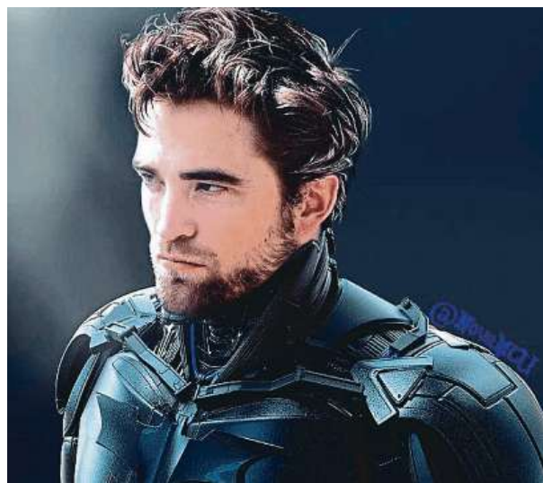
Montáž Pattinsona v „batmanském“

Asi nejvíce fanoušky historicky nejzatracovanějším představitelem filmového Batmana je herec George Clooney. Ten se za své pojetí této postavy ve filmu Batman a Robin z roku 1997 stydl tolik, že se za ni několikrát veřejně omluvil.