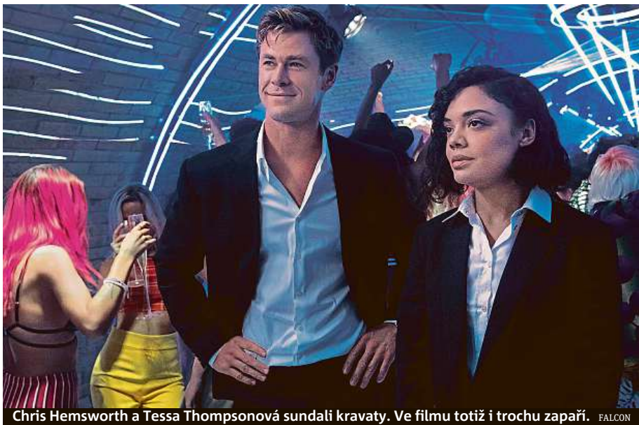
Chris Hemsworth a Tessa Thompsonová sundali kravaty. Ve filmu totiž i trochu zapáří.

Akční komedie o tajných agentech, kteří střeží Zemi před šmejdem z vesmíru, si vždy zakládala na humoru a i tentokrát vám budou při sledování cukat koutky. Však i tvůrci při výběru herců mysleli na to, že film má být sranda. Ač se to možná na první pohled nezdá, tak Chris Hemsworth (hraje britského agenta H) má komedii v krvi. Postava svůdníka, který nehraje podle pravidel, mu sedí skvěle. Arogantnímu hezounkovi dělá partnera nováček z americké centrály, kterého poslali kvůli „práci“ do Londýna. Zelenáčem je agentka M, kterou ztvárnila Tessa Thompsonová. Tahle dvojice už na plátně jednou mimo-