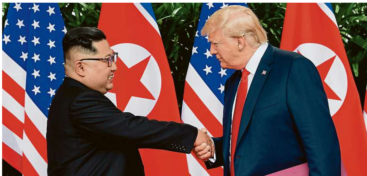
Včera proběhla schůzka prezidenta USA a vůdce KLDR. Kim slíbil ukončení jaderného programu. Více na straně 16

Hypotéky. Česká národní banka od října zpřísní podmínky pro jejich poskytování. Developeři. Varují, že o možnost kupovat si byty přijde střední třída. Nájemní bydlení. V západní Evropě je oblíbenější STRANA 10