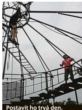
Postavit ho trvá den.