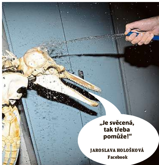
JAROSLAVA HOLOŠKOVÁ Facebook

Napište bublinu a reagujte na sloupek na: www.facebook.com/denikmetro