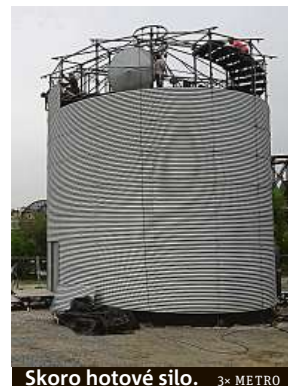
Skoro hotové silo. 3x METRO

Návštěvníci se mohou ale těšit i na další umělce. Svou show předvede například akrobat a herec David Dimitri, který skáče salta na laně a sám sebe vystřelí dělem. Představení Alea je pro změnu světovou premiérou absolventského představení zhruba dvacítky studentů z italské cirkusové školy z Turína, které vzniká exkluzivně pří-