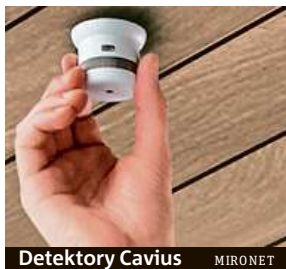
Detektory Cavius MIRONET

Ačkoli zařízení pro chytrou domácnost zaštiťují řadu funkcí, které zvyšují komfort nebo snižují náklady na energie, základem všeho by měla být bezpečnost. Právě na bezpečnost se zaměřuje celá řada výrobců, jejichž systémy dokážou ochránit vás i váš majetek. Nám padl do oka systém od společnosti Cavius.