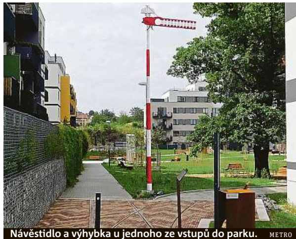
Návěstidlo a výhybka u jednoho ze vstupů do parku.

To je vlastně nejstarší ze všech obrázků. Dva roky existoval jen jako koncept na papíře. Obrázek ale popsal všechno, o co tam jde. Jde