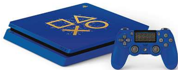
Herní konzole PlayStation 4

VR, který lze nyní pořídit v internetovém obchodě Mironet za nejnižší cenu v historii – už od 3890 korun. V nabídce ale najdete i ovladače DualShock. Výhodně zakoupíte ty nejlepší herní pecky jako Grand Turismo Sport, Horizon Zero Dawn či Uncharted 4. Pro milovníky online hraní je připravena i akční nabídka ročního předplatného ve službě PlayStation Plus za 999 korun.