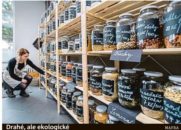
Drahé, ale ekologické

Bezobalové obchody ale začínají být v Česku pomalu běžná věc. Loni na podzim dokonce v Praze 6 otevřela bezo-