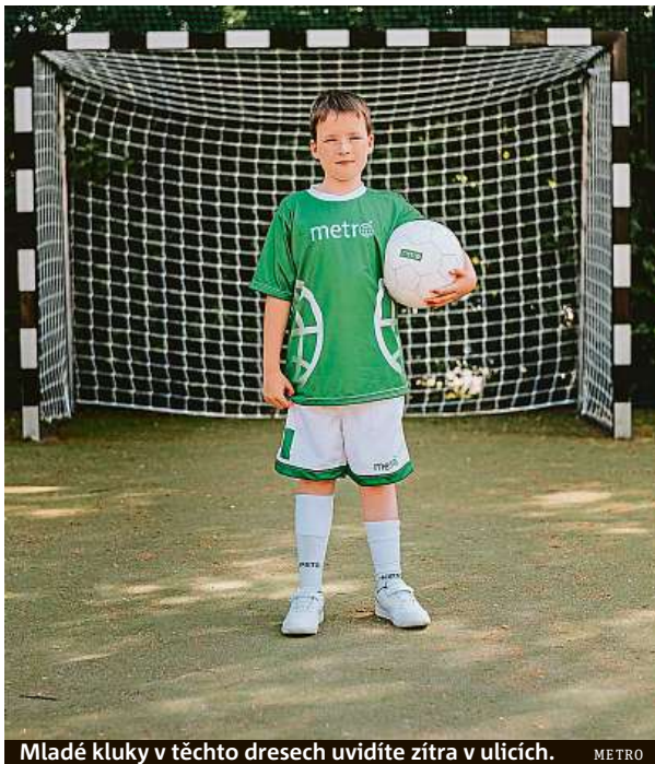
Mladé kluky v těchto dresech uvidíte zítřka v ulicích. METRO

Jejich autoři získají 300 nebo 500 korun. Ale i mikinu, deštník a fotbalový míč. MET