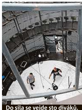
Do sila se vejde sto diváků.

Jedním z představení, které má na akci českou premiéru, je vystoupení L'Absolu. Artist Boris Gibé svou sólo show zahraje ve dvanáct metrů vysokém prostoru kruhového půdorysu, kde diváci budou sedět po celém jeho obvodu ve dvou spirálovitě nad sebou vedoucích chodbách.