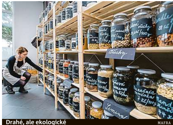
Drahé, ale ekologické

Bezobalové obchody ale začínají být v Česku pomalu běžná věc. Loni na podzim dokonce v Praze 6 otevřela bezo-