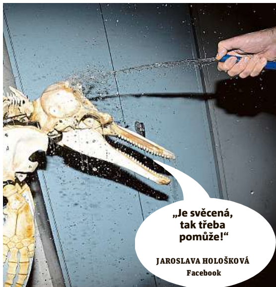
JAROSLAVA HOLOŠKOVÁ Facebook