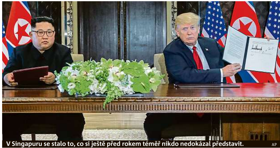
V Singapuru se stalo to, co si ještě před rokem téměř nikdo nedokázal představit.