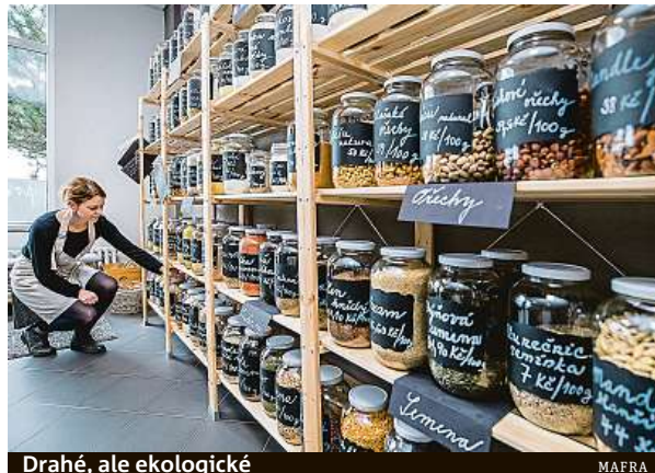
Drahé, ale ekologické

Bezobalové obchody ale začínají být v Česku pomalu běžná věc. Loni na podzim dokonce v Praze 6 otevřela bezo-