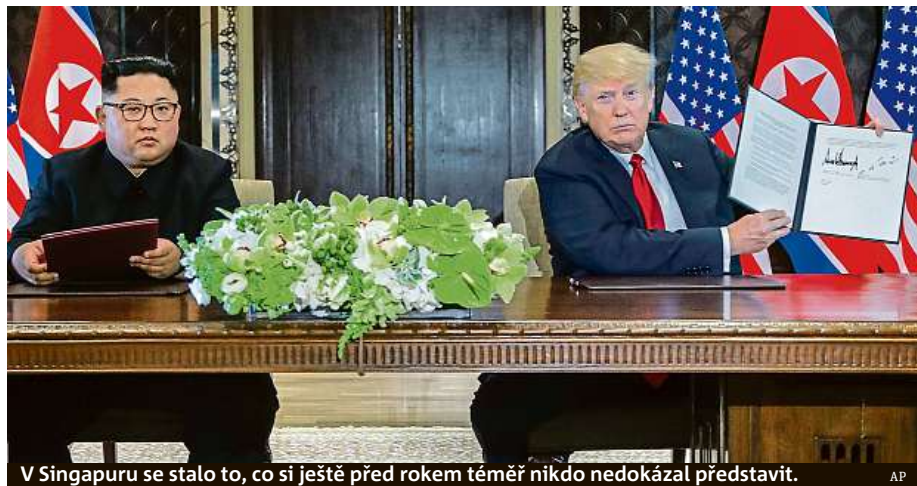
V Singapuru se stalo to, co si ještě před rokem téměř nikdo nedokázal představit.