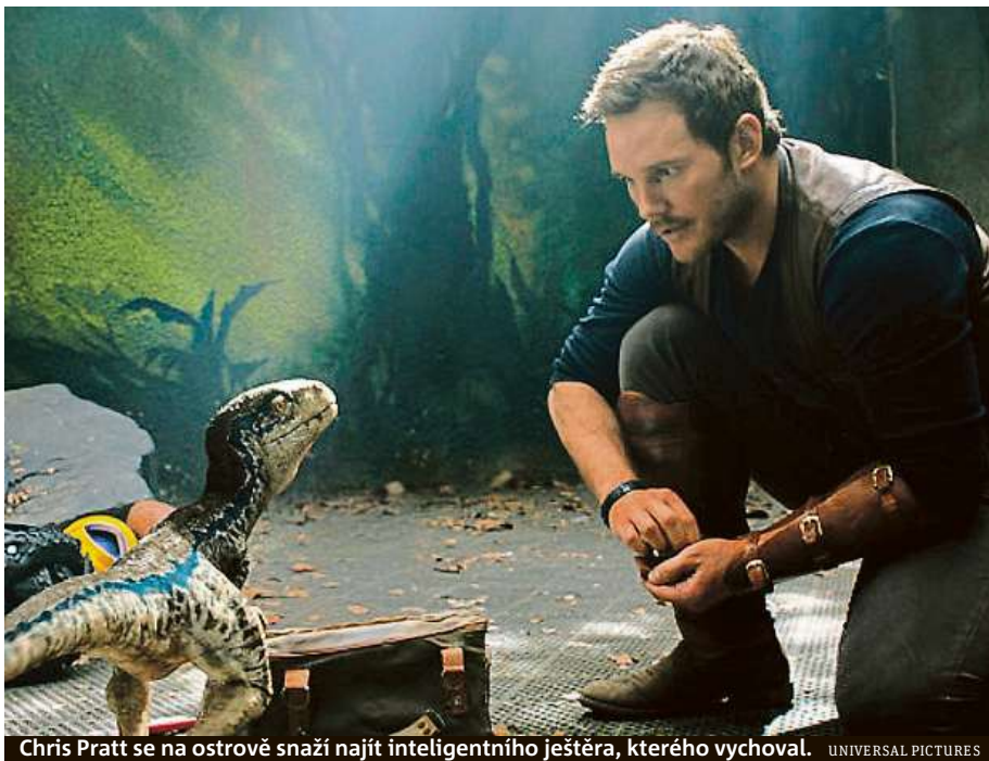
Chris Pratt se na ostrově snaží najít inteligentního ještěra, kterého vychoval.

Owena žene na ostrov touha najít a spasit Blue, inteli-