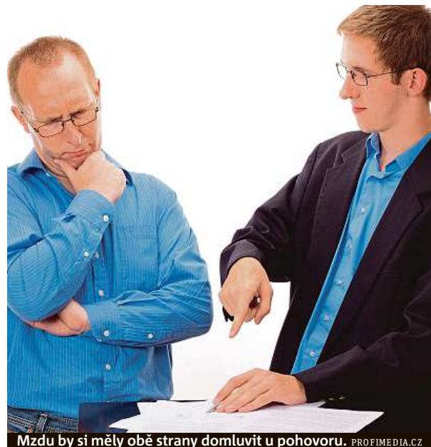
Mzdu by si měly obě strany domluvit u pohovoru.

Každá společnost se může samozřejmě sama rozhod-