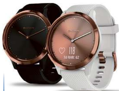
Garmin vívomove Optic Sport

Vypadají jako běžné hodinky, pod povrchem ale ukrývají řadu chytrých funkcí. Jednodušší modely umí motivovat ke změně životního stylu, ty dokonalejší změní podrobně širokou škálu sportovních aktivit. Společně pak sluší se sportovním i slavnostnějším oblečením.