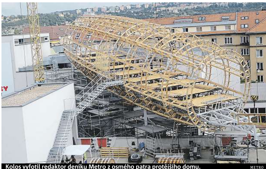
Kolos vyfotil redaktor deníku Metro z osmého patra protějšího domu.

Podle informací městské části Praha 7 bude po dokon-