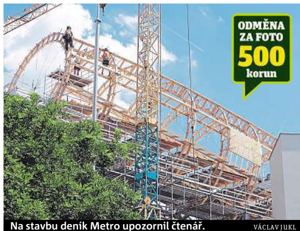
Na stavbu deník Metro upozornil čtenář.