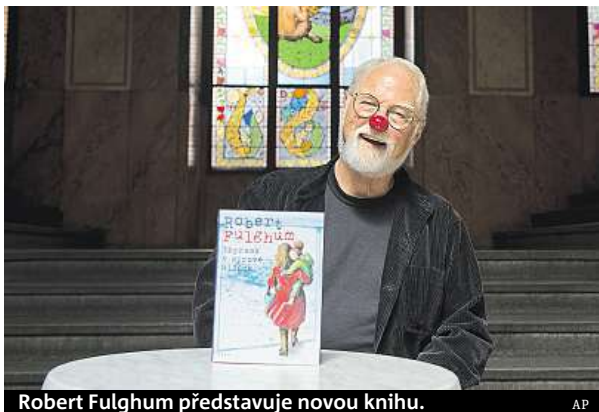
Robert Fulghum představuje novou knihu.

Známý americký spisovatel Robert Fulghum si Čechy oblíbil. Chce poznat Čechy a napsat o nich knihu. Představí také svou novou knihu Poprask v syrové uličce. Po krátké zastávce v Praze se vydal na turné s projektem Listování. První dvě představení Létaujícího cirkusu v Prostějově a Olomouci byla beznadějně vyprodaná, spisovatel téměř hodinu po skončení představení podepisoval své knihy. Do dobrodružného tur-