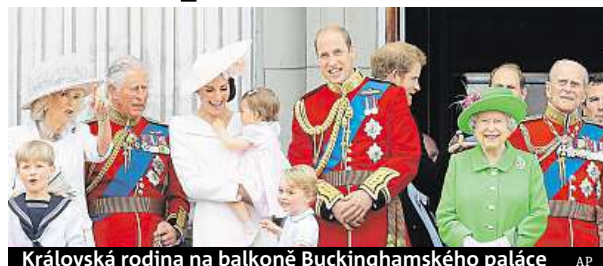
Královská rodina na balkoně Buckinghamského paláce

Tradiční vojenské přehlídky v centru Londýna byly v sobotu ústředním bodem druhého dne oficiálních oslav 90. narozenin britské královny Alžběty II. Panovnice se poté objevila na balkoně Buckinghamského paláce v doprovodu celé královské rodiny. Včera královna uspořádala charita-