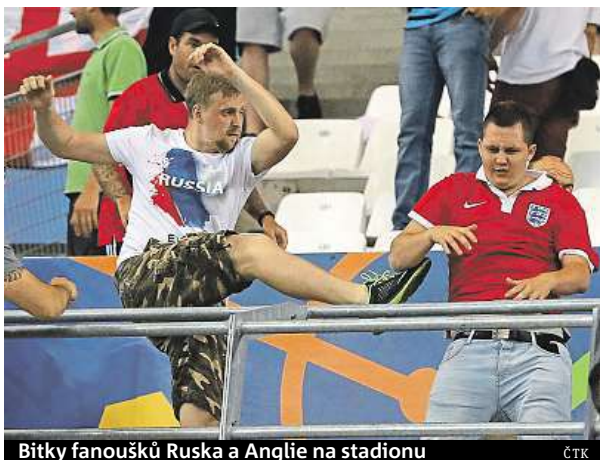
Bitky fanoušků Ruska a Anglie na stadionu

Ruský ministr sportu Vitalij Mutko očekává vysokou pokutu. „Sami vyšetřujeme, co se stalo,“ řekl Mutko. Podle něj však chybovali i pořadatelé. „V takových zápasech je třeba oba tábory od sebe oddělit. Také se tam objevila pyrotechnika, což je špatně. Nebyla tam žádná síť pořadatelů, která by tomu zamezila,“ uvedl Mutko a dodal, že bude usilovat o potrestání Rusů, u kterých se prokáže vina. Zatím