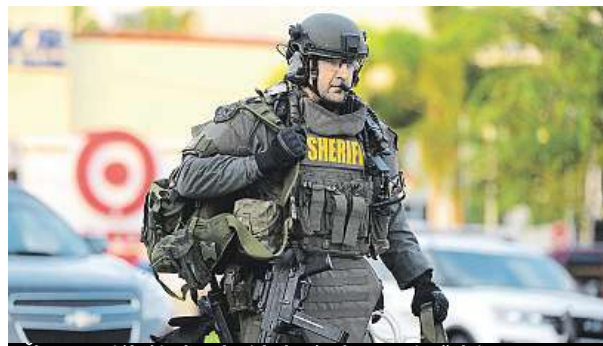
Člen speciální jednotky jde k zásahu proti střelci.

Včerejší útok ve floridském klubu má nejvíce obětí v historii země.