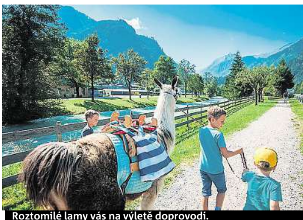
Roztomilé lamy vás na výletě doprovází.