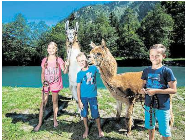
3x ZELL AM SEE-KAPRUN TOURISMUS GMBHKA