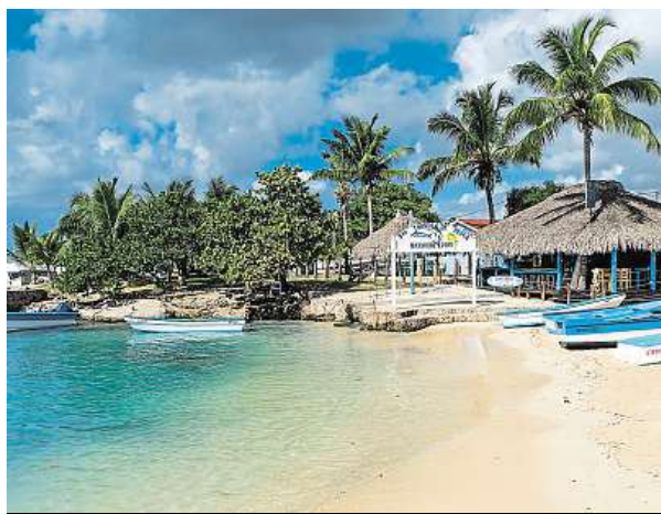
Oblíbené pláže v Dominikánské republice

Silnou tradicí tesařství a rukodělné výroby užžitných a