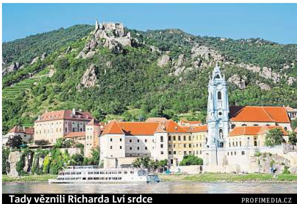
Tady věznili Richarda Lví srdce

Malebné údolí Wachau kopíruje tok řeky Dunaje. Z Prahy sem dojedete za čtyři hodiny. Po celé jedné straně řeky se tyčí nespočet vinic rozestých po terasách stovky met-