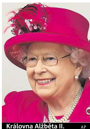
Královna Alžběta II.

Královna slaví. Vojsko i oběd pro tisíce lidí