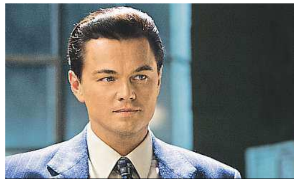
DiCaprio ve filmu Vlk z Wall Street

Fotbalové mistrovství světa, které včera začalo v Brazílii, má i diváky z řad celebrit. Patří mezi ně také americký herec Leonardo DiCaprio (viz foto), který společně s jednadvaceti přáteli ve středu odletěl do Rio. Domovem hollywoodské hvězdy a jeho přátel je sto čtyřicet sedm metrů dlouhá luxusní jachta Topaz, která patří šejkovi Mansúrovi z Abú Zabí. Šejk je velký fotbalový fanoušek a také vlastník fotbalového klubu Manchester City. ČTK