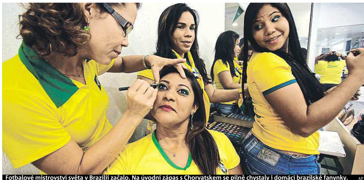
Fotbalové mistrovství světa v Brazílii začalo. Na úvodní zápas s Chorvatskem se pilně chystaly i domácí brazilské fanyanky.

Bankovní poplatky. Nejvíce nás štvou, jsou hlavním důvodem změny finančního ústavu. Menší banky. Za poslední roky zlanarily více než milion klientů. Váš výběr. Podle počtu příkazů a sítě bankomatů STRANA 3