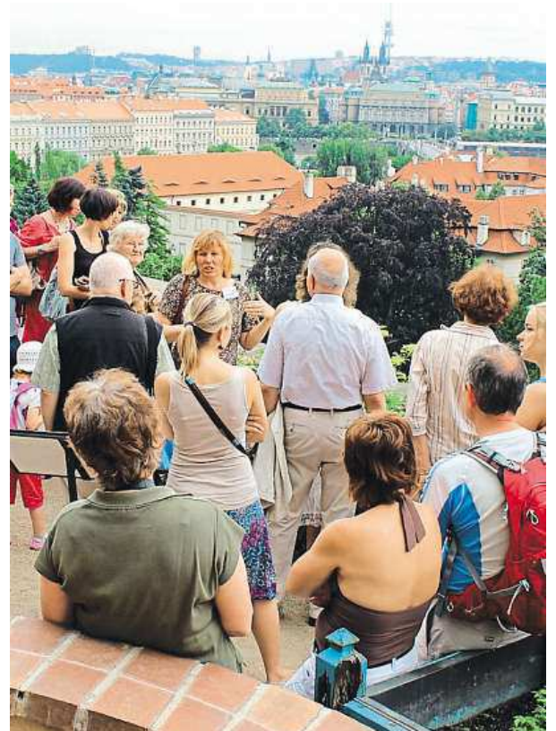
Návštěvníky čekají i komentované prohlídky.

jemci navštívit běžně zavřenou umělou jeskyni Peklo a Slavičí ostrov. Zítra večer za-