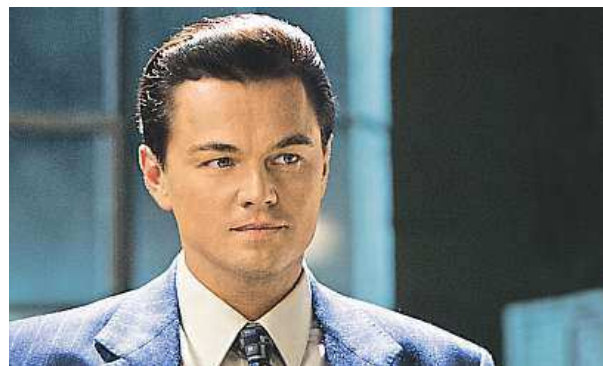
DiCaprio ve filmu Vlk z Wall Street

Fotbalové mistrovství světa, které včera začalo v Brazílii, má i diváky z řad celebrit. Patří mezi ně také americký herec Leonardo DiCaprio (viz foto), který společně s jednadvaceti přáteli ve středu odletěl do Ria. Domovem hollywoodské hvězdy a jeho přátel je sto čtyřicet sedm metrů dlouhá luxusní jachta Topaz, která patří šejkovi Mansúrovi z Abú Zabí. Šejk je velký fotbalový fanoušek a také vlastník fotbalového klubu Manchester City. ČTK