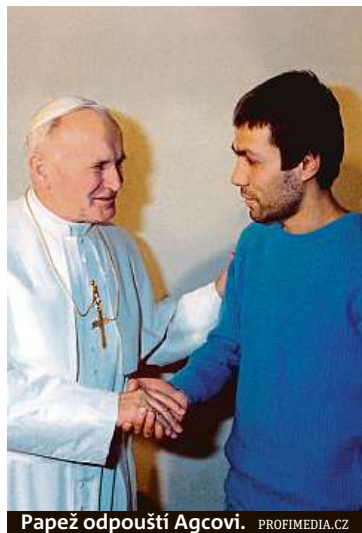
Papež odpouští Agcovi.

Jan Pavel II. přičítal to, že při atentátu vyvázl sice těžce raněn, ale živý, Panně Marii Fátimské. Papež Agcovi veřejně odpustil již tři dny po činu a o dva roky později ho dokonce navštívil v jeho cele. ČTK