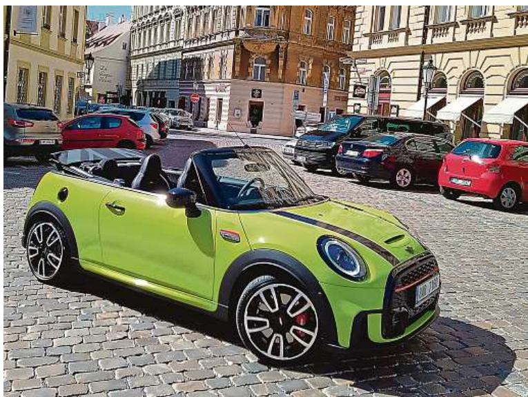
Největší změna: maska chladiče je šestihránná a mnohem výraznější.