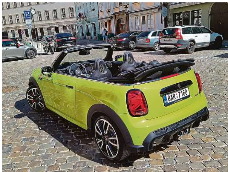
Stažení střechy zabere jen pár vteřin. Poskládá se nad kufr.