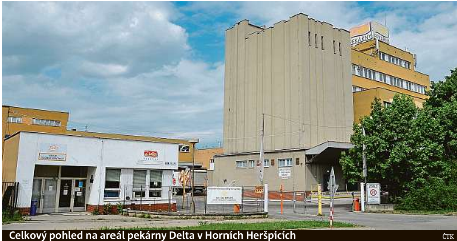
Celkový pohled na areál pekárny Delta v Horních Heršpicích

Podle něj jsou také výrobní technologie v pekárně Delta zastaralé a na hranici životnosti. United Bakeries plánuje propustit až 160 lidí, bu-