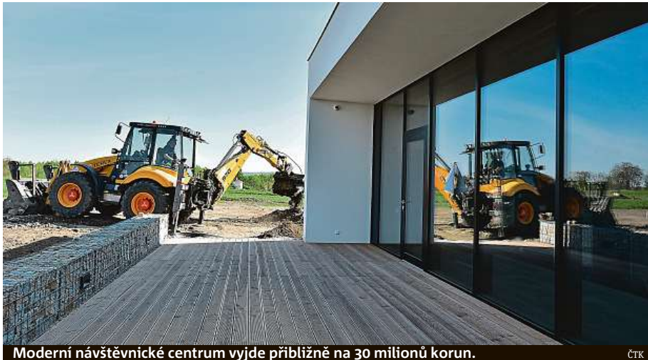
Moderní návštěvnické centrum vyjde přibližně na 30 milionů korun.

Stavba návštěvnického centra, které bude přibližovat výsledky archeologického průzkumu Hradiska u Mušova i nálezy z doby Římské říše, vyjde přibližně na 30 milionů korun a ústav ho staví za finančního přispění Akademie věd. „Hradisko Mušov je na našem území nejautentičtější lokalitou se stopami starověkých Římanů. I na jiných místech na našem území jsme našli stopy pobytu římské armády, ale tam šlo o vojenské tábory, kdežto Hradisko je trvalejší zástavbou na-