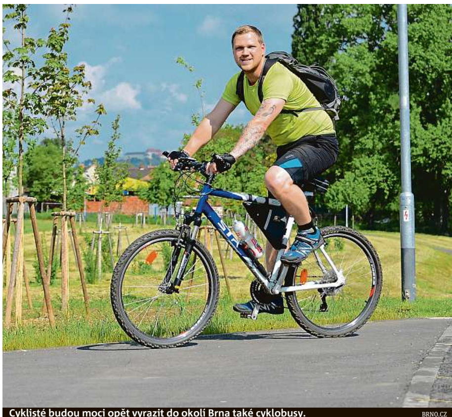
Cyklisté budou moci opět vyrazit do okolí Brna také cyklobusy.

Současný režim provozu je tak podle něj dostačující a záleží na vedení Jihomoravského kraje, zda se rozhodne případně vrátit k běžným jízdnicím rádkům. ČTK