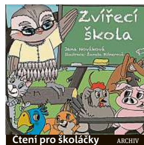
Čtení pro školáčky