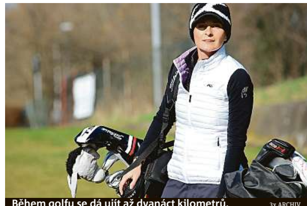
Během golfování se dá ujit až dvanáct kilometrů.

Ano. Mám několik nadějných mladých svěřenců, kterým se snažím předávat své zkušenosti. S taškou doufáme, že budeme na konci srpna moci uspořádat druhý ročník Tipsport Czech Ladies Open, což je ženský golfový turnaj nejvyšší evropské sou-