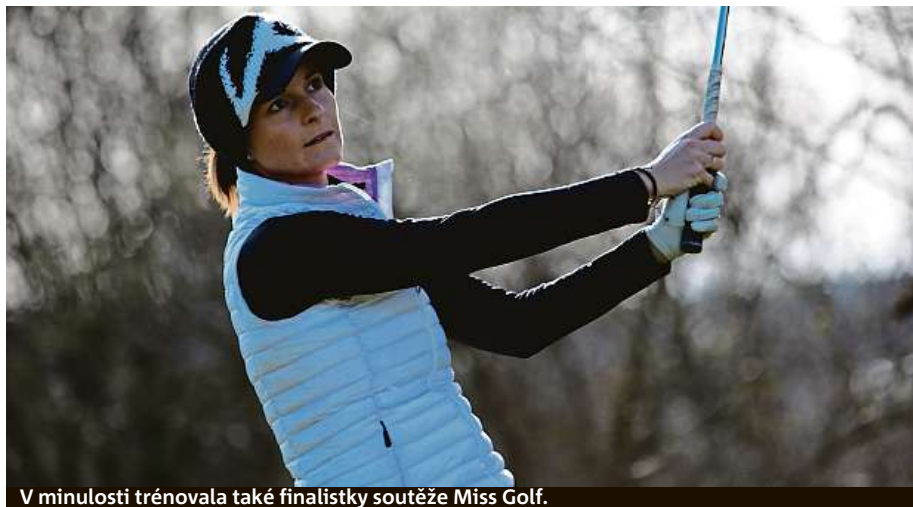
V minulosti trénovala také finalistky soutěže Miss Golf.