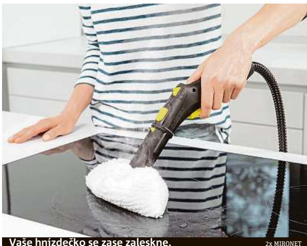
Vaše hnízdečko se zase zaleskne.

Síla páry si hravě poradí se špinou i záluďnými bakteriemi.