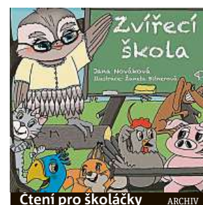
Čtení pro školáčky