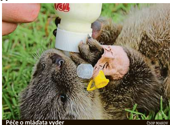
Péče o mláďata vyder

Na volně žijící zvířata mají negativní dopad také nařízená omezení proti šíření koronaviru. Lidé totiž začali daleko více hromadně vyrážet do přírody. Podle zástupců Zá-