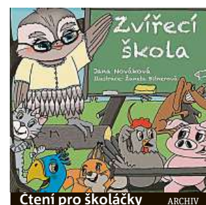
Čtení pro školáčky