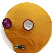
Tomáš Kubák Podle mě panuje ideální teplota.