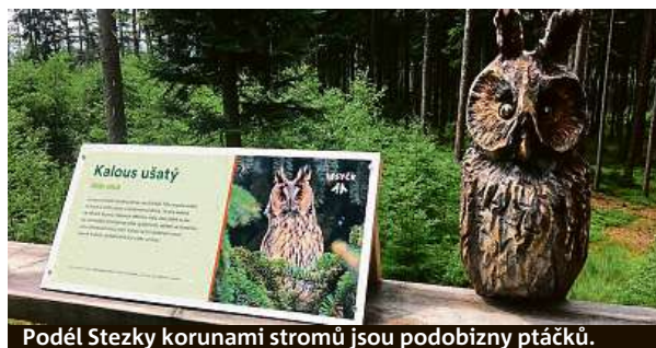
Podél Stezky korunami stromů jsou podobizny ptáčků.