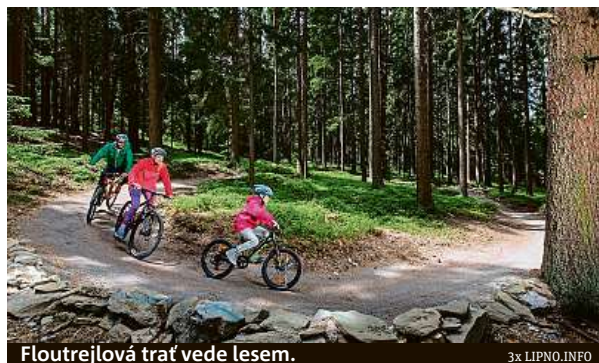
Floutrejlová trať vede lesem.

A jak se dostat dolů? I zde si můžete vybrat. Sjet se dá na koloběžkách po tři a půl kilometru dlouhé trase. „Cestou čeká na návštěvníky také speciální lesní úsek plný zatáček a houpáků, který ale na koloběžce hravě zvládne každý, včetně dětí,“ přibližuje