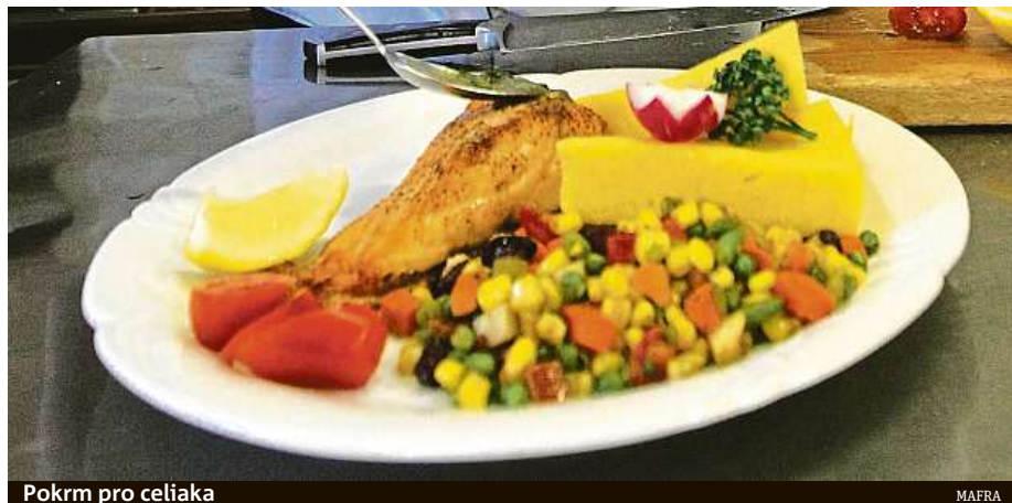
Pokrm pro celiaka