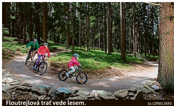
Floutrejlová trať vede lesem.

A jak se dostat dolů? I zde si můžete vybrat. Sjet se dá na koloběžkách po tři a půl kilometru dlouhé trase. „Cestou čeká na návštěvníky také speciální lesní úsek plný zatáček a houpáků, který ale na koloběžce hravě zvládne každý, včetně dětí,“ přibližuje