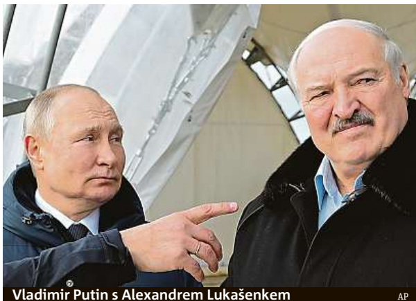
Vladimír Putin s Alexandrem Lukašenkem

Rusko prý nemělo jinou možnost, protože se musí chránit, a operace byla jen