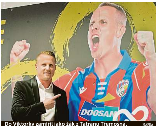
Do Viktorie zamířil jako žák z Tatraru Třemošná.