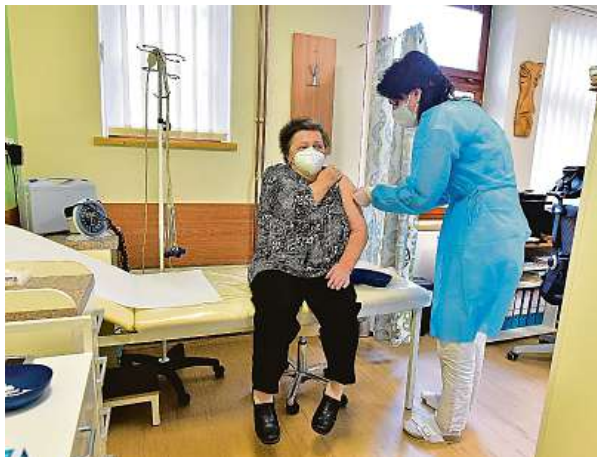
Na českém venkově je o praktické lékaře nouze.