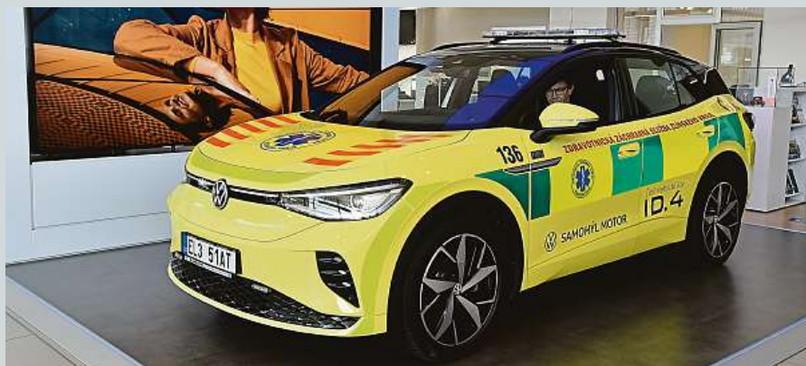
Zdravotnická záchraná služba Zlínského kraje má elektromobil Volkswagen ID.4. ČTK

né péče využívá automobil poháněný čistě elektrickou energií. Cílem projektu je zjistit, zda a za jakých podmínek by bylo možné v budoucnu zařadit elektromobily do vozového parku ZZS ZK nastálo. Nabíjení ID.4 GTX probíhá kabelem s koncovkou na 380 V, na což jsou výjezdové základny připraveny. Nebylo tedy potřeba podniknout žádné stavební či jiné úpravy. Dojezd elektromobilu na jedno nabití se pohybuje mezi 340 a 480 kilometry. Vůz má pohon všech kol. ČTK