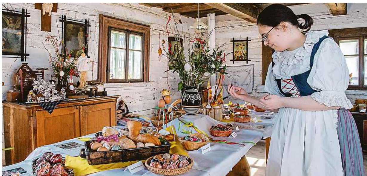
Na Srámkově statku v Hradci Králové chystají velikonoční program. Od 14. do 18. dubna proběhnou Velikonoce na statku.

Dvoji účinek. Ukrajínští lékaři usnadní českému kolegovi komunikaci s ukrajinským pacientem, nejsou u nás zbyteční. Penize. Praktik může získat 10 tisíc korun. Nové formuláře. Cizinec zakreslí příznaky STRANY 4, 5