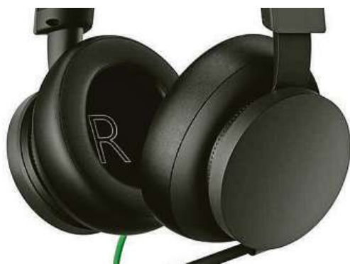
Super sluchátka za super cenu

Neobyčejně jemná a velká sluchátka s integrovaným ovládním hlasitosti vám zajistí maximální pohodlí, které vydrží i při dlouhém hraní. Pokud se navíc rozhodnete pořídit si ke sluchátkům Microsoft PC GamePass, získáte na něj slevu 33 %. Poříďte si designová sluchátka s mikrofonem Xbox Series v internetovém obchodu Mironet.cz za 999 korun.