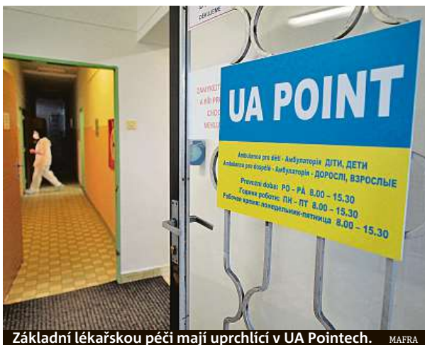
Základní lékařskou péči mají uprchlíci v UA Pointech.

Pro lékaře je to však složitější. I přes podobnost mnoha slov a frází vyžaduje domluva lékaře s pacientem přesnost. Ruština se obecně z české populace už většinou vytratila, o té odborné lékařské ani nemluví. V Česku jsou momentálně mezi Ukrajinci nejen lidé s nejrůznějšími chronickými chorobami. Dorazily k nám ale také těhot-