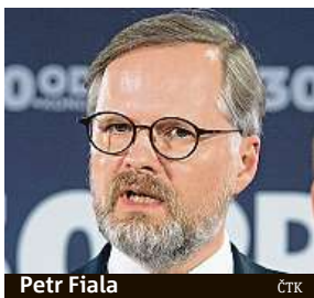
Petr Fiala

V souvislosti s válkou na Ukrajině se ohledně stálé přítomnosti americké armády v Česku vyjádřil šéf vlády a předseda ODS Petr Fiala. „Je to určitě pěkné téma. Pro mě jako občanského demokrata se to pěkně poslouchá, ale opravdu je to jenom hezké přání,“ řekl pro Aktuálně.cz. Zdůraznil, že nejde o aktuální téma.