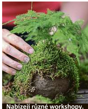
Nabízejí různé workshopy.