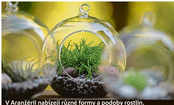
V Aranžérii nabízejí různé formy a podoby rostlin.