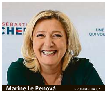
Marine Le Penová