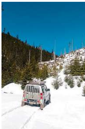
Krkonošský „turista“ KRMAP

„To, že máte silné terénní auto, ani to, že jsou Krkonoše