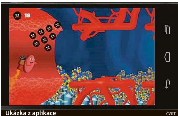
Ukázka z aplikace

Malý pacient ve věku pět až deset let se ve hře stará o virtuálního kamaráda trpícího diabetem. Pravidelně mu měří glykémii, podává vhodnou stravu a aplikuje inzulín a sám se tak učí reagovat na komplikace, které jsou s nemocí spojené. Za péči děti dostávají virtuální peníze, hra je postavená na gamifikační ekonomii, která je motivuje a baví. „Pozitivní re-