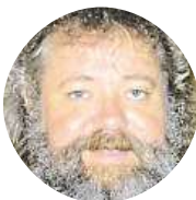
Pavel Físpa Horší než pátek třináctého je každé pondělí.