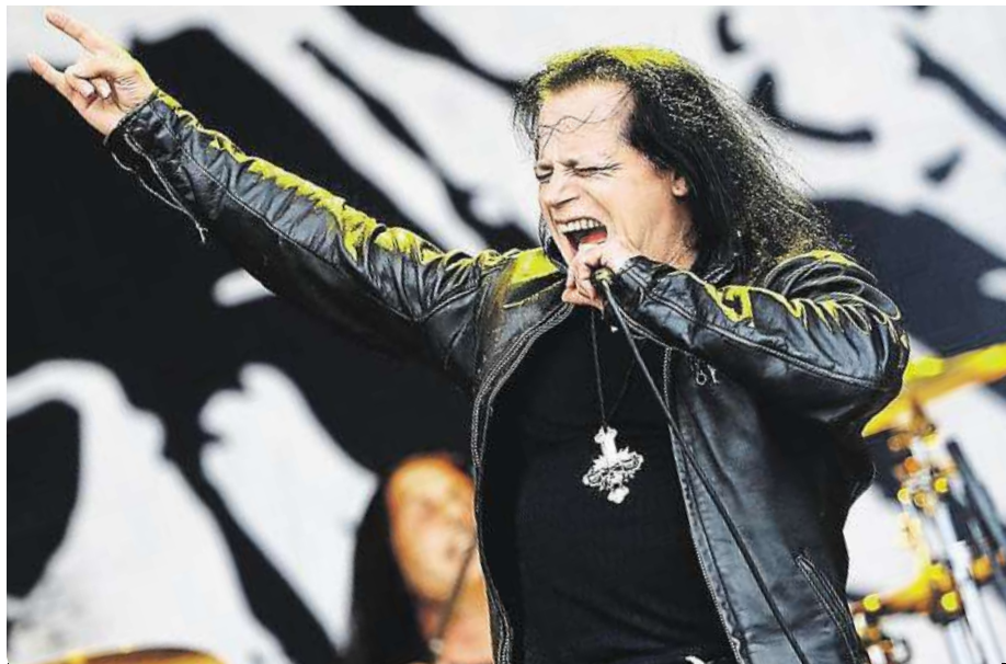
Vypadá jinak než Elvis. Ale ten zpěv... zadejte si do YouTube „Elvis vs evil Elvis“.

„Slunce nesvítí a vítr nebude foukat, až se schováš, bez své lásky, hluboko dovnitř,“ zpívá prociťeně v songu Sistinas americký rocker Glenn Danzig. Kdyby v roce 1992, kdy tuto romantickou skladbu vydal, existovala škatulka „emo“, možná by ji obdržel. Jenže Glenn Danzig, to je spíše tvrdý, jeho slovy dokonce až hororový rock. Fantaskní láskyplné výlety s ním posluchači zažívají pouze občas.