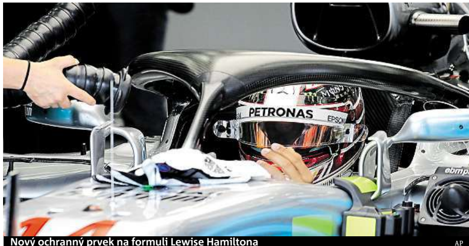
Nový ochranný prvek na formuli Lewise Hamiltona

Už osmkrát v řadě bude výhradním dodavatelem pneumatik šampionátu italský výrobce Pirelli. V porovnání s minulou sezonou bude namísto sedmi typů pneumatik vyrábět až devět. Přibyla nejměkčí směs „hypersoft“ a nejtvrďší „superhard“. Všechny směsi pro sezonu 2018 mají být až o dva stupně měkčí než ty v minulém roce. Znamená to, že na okruzích dojde k jejich rychlejšímu opotřebení. Cílem Pirelli je zabezpečit v průměru minimálně dvě zastávky v boxech během závodů. MET