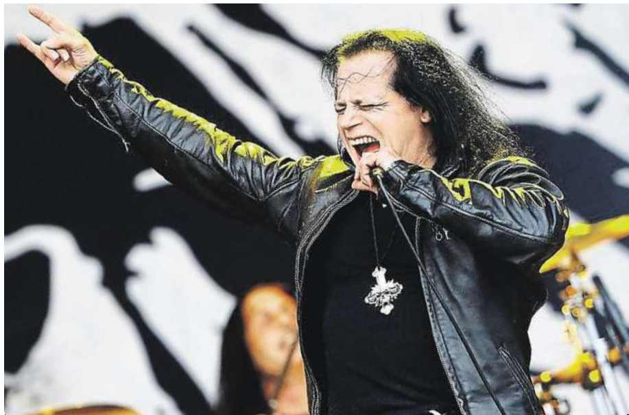
Vypadá jinak než Elvis. Ale ten zpěv... zadejte si do YouTube „Elvis vs evil Elvis“.

„Slunce nesvítlí a vítr nebude foukat, až se schováš, bez své lásky, hluboko dovnitř,“ zpívá prociťeně v songu Sistas americký rocker Glenn Danzig. Kdyby v roce 1992, kdy tuto romantickou skladbu vydal, existovala škatulka „emo“, možná by ji obdržel. Jenže Glenn Danzig, to je spíše tvrdý, jeho slovy dokonce až hororový rock. Fantaskní láskyplné výlety s ním posluchači zažívají pouze občas.