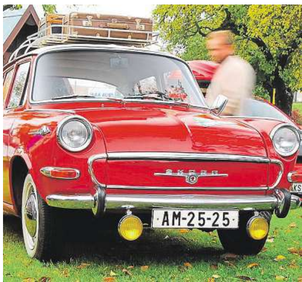
Milovníci veteránů ukazují své poklady i na aukcích.

Nezbavujte se aut po dědečkovi. Veteráni z východního bloku možná vydělají víc než zlato.