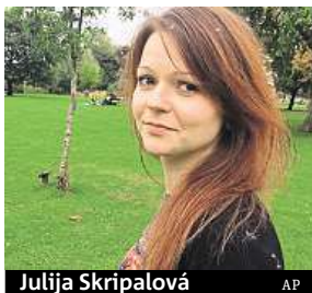
Julija Skripalová

Po propuštění z nemocnice střeží Skripalovou zřejmě tajná služba MI6.