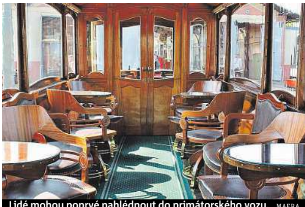
Lidé mohou poprvé nahlédnout do primátorského vozu.

Upravená expozice umožní poprvé nahlédnout do salonního vozu č. 200, který byl v minulosti využíván pražskými primátory. Populární Tereza je nejkrásnější praž-