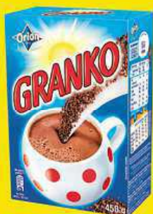
ORION GRANKO 450 g