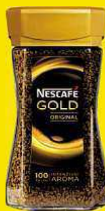
NESCAFÉ GOLD 200 g