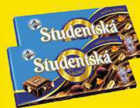
ORION, STUDENTSKÁ PEČŤ 180 g, různé druhy