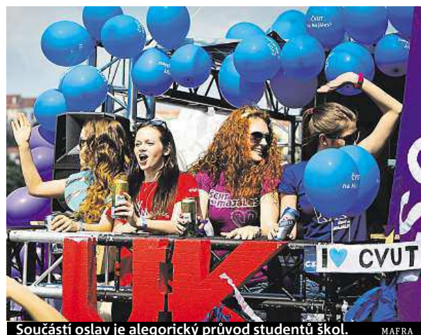
Součástí oslav je alegorický průvod studentů škol.

Největším lákadlem je podle pořadatelů příslibená účast kapely Kryštof, která se na Majálesy vrací po třech letech a vystoupí ve všech třech městech. „Byli první