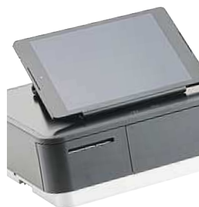
Pokladna mPOP MIRONET

Pokladna kromě klasické zásuvky na mince a bankovky umožňuje rovnou tisknout účtenky. Disponuje bezdrátovým rozhraním Bluetooth pro spárování s tablety či chytrými telefony na platformách iOS a Android.