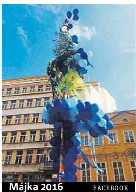
Májka 2016 FACEBOOK

Kdy: 29. dubna Kde: Letiště Letňany Zajímavosti: Ve vedlejší areálu bude probíhat 2. ročník festivalu Utubering zaměřený na youtubové fanoušky. Na ten je potřeba mít zakoupenou samostatnou vstupenku.