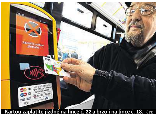
Kartou zaplatíte jízdné na lince č. 22 a brzo i na lince č. 18.

Tramvaj míří do centra a já vyhlížím turisty, kteří budou mít o automat větší zájem než Pražáci s tramvajenkou. Na I. P. Pavlova přistupují Rusové, Číňané, Italové. Moje chvíle ale přichází až na Újezdě, kdy si jeden z asijských turistů začíná cosi mač-