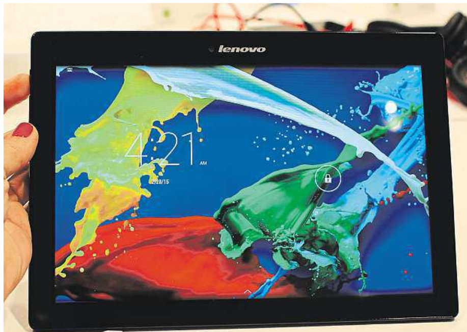
Lenovo Tab2 A10-70 je rychlý a má skvělý fotoaparát.

Dalšími příjemnými vlastnostmi jsou vydařený prostorový zvuk a stylový design v neotřelém barevném provedení. Ačkoli fotografie u tabletů nebývají zrovna předností, A10-70 pořízuje bravurní snímky zásluhou dvojice fotoaparátů s rozlišením 8 a 5 Mpix.