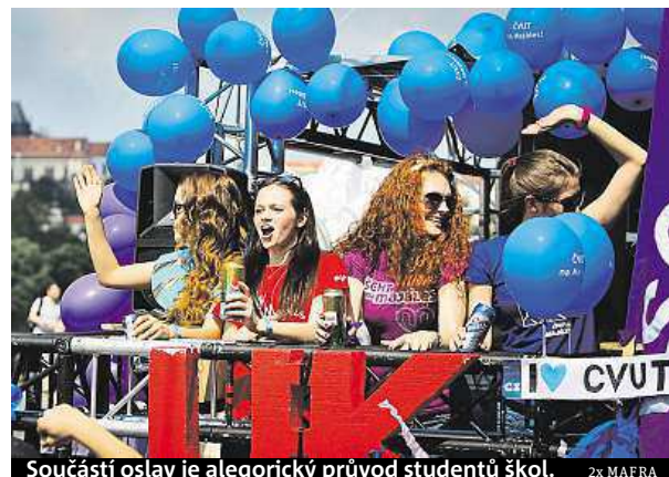
Součástí oslav je alegorický průvod studentů škol.

999 korun. Ceny se s blížícím datem konání zvýší na 499 korun.