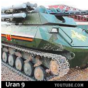
Uran 9

Naprogramované zbraně mohou začít válčit už za několik let.