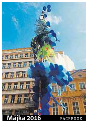
Májka 2016 FACEBOOK

Zajímavosti: Ve vedlejším areálu bude probíhat 2. ročník festivalu Utuberling zaměřený na youtubové fanoušky. Na ten je potřeba mít zakoupenou samostatnou vstupenku.