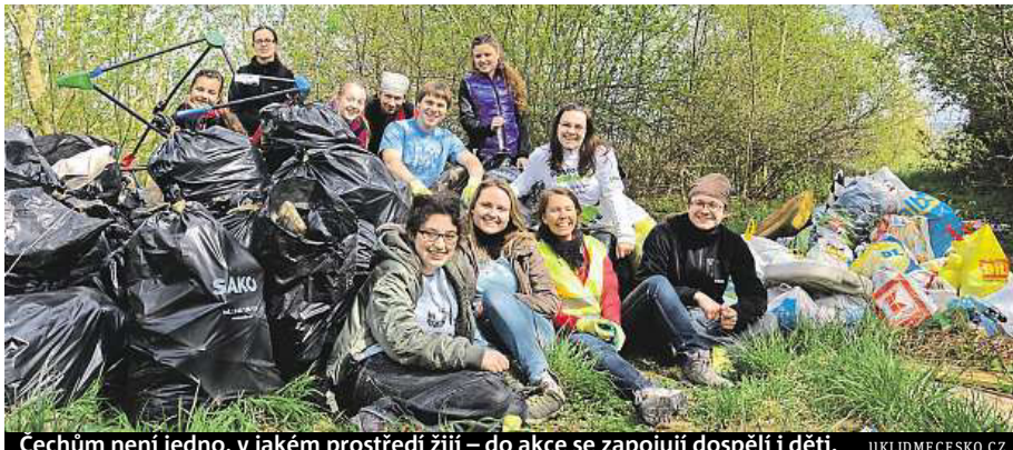
Cechům není jedno, v jakém prostředí žijí – do akce se zapojují dospělí i děti. UKLIDMECESKO.CZ

Parta z Orlové je jedna z 1800 skupin, které vyrazí v rámci akce Uklidíme Česko o víkendu do terénu, aby zlikvidovaly černé skládky. „Snažíme se v lidech podpořit energii udělat něco užitečného pro své okolí, zapojit vlastní ruce, ukázat, že to jde, a na-