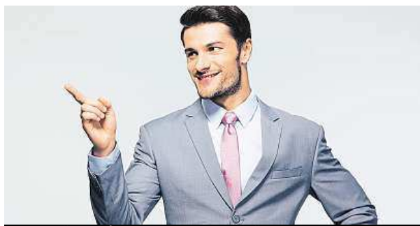
Vysokoškoláků je na trhu práce příliš.

Získaný vysokoškolský diplom nemusí nutně znamenat pro uchazeče během hledání zaměstnání výhodu.