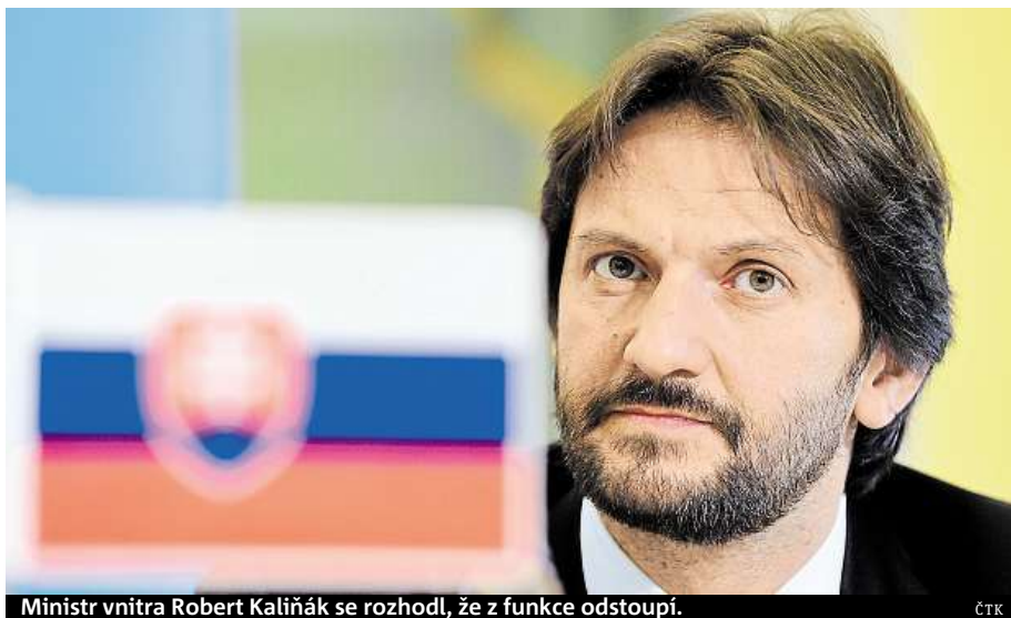
Ministr vnitra Robert Kaliňák se rozhodl, že z funkce odstoupí.

Kaliňák, který je místopředsedou Smeru-SD, je druhým ministrem kabinetu premiéra Roberta Fica, který po dvojnásobné vraždě oznámil rezignaci. Minulý týden ve funkci skončil ministr kultury a Kaliňákovu stranický kolega Marek Madarič.