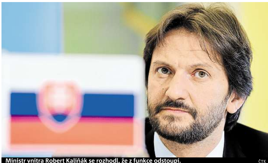
Ministr vnitra Robert Kaliňák se rozhodl, že z funkce odstoupí.

Kaliňák, který je místopředsedou Smeru-SD, je druhým ministrem kabinetu premiéra Roberta Fica, který po dvojnásobné vraždě oznámil rezignaci. Minulý týden ve funkci skončil ministr kultury a Kaliňákovu stranický kolega Marek Maďarič.