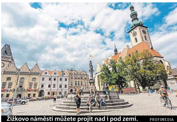
Žižkovo náměstí můžete projít nad i pod zemí.

Jestli se chcete více dozvědět o historii Tábora, zajděte se podívat do podzemí Husitského muzea . Obědte zároveň téměř celé náměstí, respektive nahlédnete do složi-