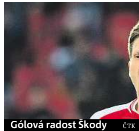
Gólová radost Škody

Fotbalistům Sparty se dál nedaří, včera prohráli v Mladé Boleslavi 0:1. SIM