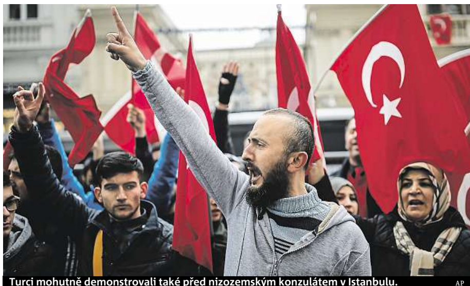
Turci mohutně demonstrovali také před nizozemským konzulátem v Istanbulu.

Mezi Tureckem a Nizozemskem vypukla o víkendu diplomatická roztržka.