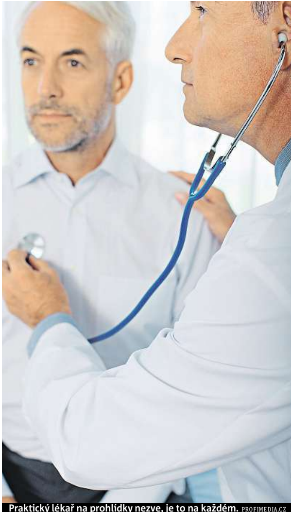
Praktický lékař na prohlídky nezve, je to na každém.

Praktický lékař vás na preventivní prohlídky nezve, je to na vás, zda přijдете, či nikoli. Při samotné prohlídce zkontroluje očkování, dále kůži, sliznice, jazyk, hrdlo, štítnou žlázu a hlavní skupiny uzlin. Součástí prohlídky je také vyšetření srdce a plic poklepek a poslechem. Lékař změří tep a krevní tlak, prohmatá břicho, prozkoumá oblast ledvin