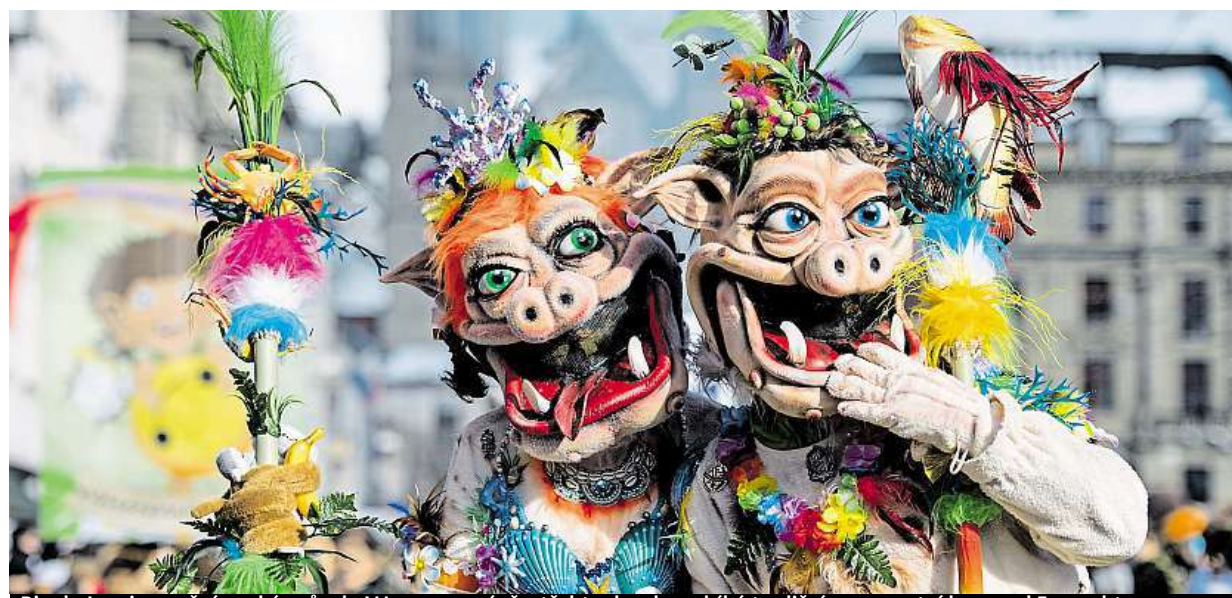
Rio de Janeiro na švýcarský způsob. V Luzernu právě v těchto dnech probíhá tradiční masopustní karneval Fasnacht.

Konec poplachu. Dvě stě padesát gramů másla teď stojí polovinu loňské ceny. Hysterie. Lidé se už o levné máslo v obchodech neperou. Farmáři. Cenové skoky se jich netýkají, kostka stále stojí kolem stovky STRANA 8