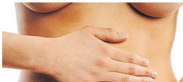
Trable trávicího traktu

Calprotectin je protein, který je zjišťován ve vyšší koncentraci během střevního zánětu, například při ulcerózní kolitidě, Crohnově chorobě či bakteriální infekci zažívacího traktu. Běžná laboratorní vyšetření zánětu v krvi ne-