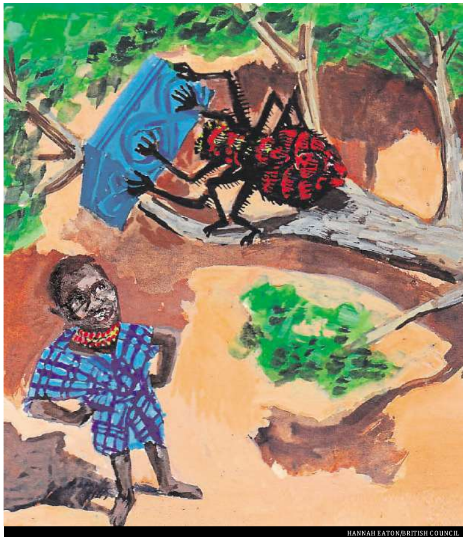
HANNAH EATON/BRITISH COUNCIL

the tree with the box in his arms. He laughed and laughed. 'Why don't you