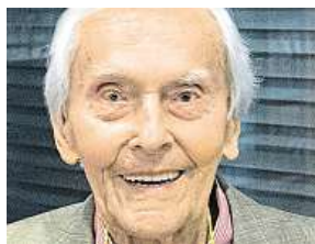
V listopadu 2017

Miroslav Zikmund se narodil 14. února 1919 v Plzni. Na Vysoké obchodní škole se seznámil s Jiřím Hanzelkou. První plány na cestu kolem