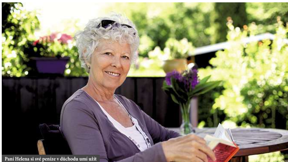
Paní Helena si své peníze v důchodu umí užít