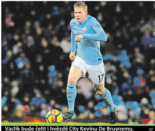
Vaclík bude čelit i hvězdě City Kevinu De Bruynemu.

Třetím Čechem v osmifinále je Patrik Schick z AS Řím, které příští týden narazí na Šachtar Doněck. To je na první pohled nejméně atraktivní vyřazovací duel. Zato souboje Realu s Paříží či Barcelony s Chelsea jsou úplnou „hrou o trůny“. A také o trenéry. Vždyť nahnuté to má jak Zinedine Zidane, který je s Re-