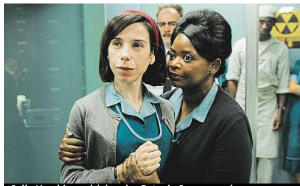
Sally Hawkinsová (vlevo) a Octavia Spencerová

Významnou poetickou roli hraje ve filmu voda. Slyšíte ji v citlivé hudbě a vidíte na mnoho způsobů. Milování či autoerotika v koupelně, vrou-