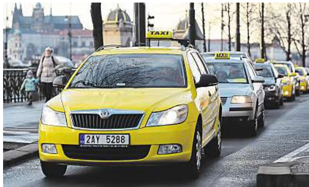
Taxikáři včera blokovali provoz i na vltavském nábřeží.

Taxikáři se sešli kolem 14. hodiny na Strahově, po čtvrté dorazili na nábřeží,