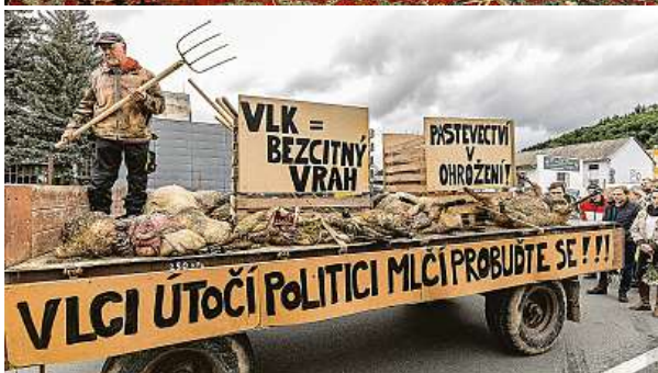
Ti „nahore“ nerozumějí „nám dole“. Skupiny obyvatel se vůči sobě vymezují jak na internetu, tak v reálném životě.