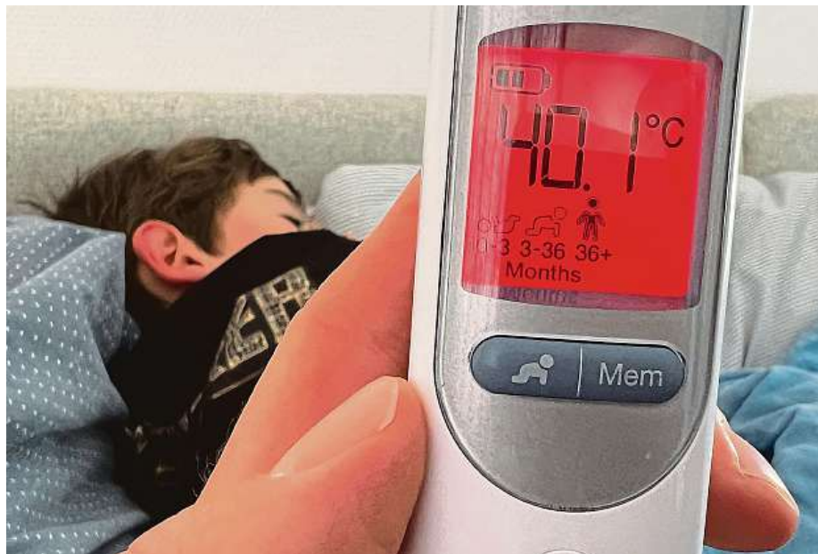
Tělo spotřebovává o dvanáct procent víc tekutin s každým stupněm nad 37 °C. Lidé by v takovém případě měli průběžně popíjet menší množství tekutin a nedělat velké pauzy.

Snížení horečky tak lze docílit pomocí léků, které obsahují paracetamol nebo ibuprofen. Silnější metamidol je pak vázán na předpis. „Cílem není dostat teplotu na normální hodnotu, stačí ji snížit o 1 až 2 °C, aby se tělu ulevilo,“ vysvětluje lékařka.