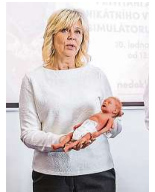
Paula 2.0 si pochovala také žena českého prezidenta Eva Pavlová.