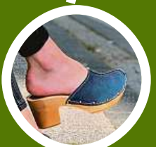
Dřeváky jsou zpět ve velkém stylu.