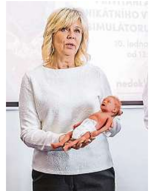
Paula 2.0 si pochovala také žena českého prezidenta Eva Pavlová.

Některé z nich je možné na Paulovi rozpoznat i pohledem, například jeho kůže dokáže zmodrat, jako by se to stalo u živého miminka v případě nedostatku kyslíku. Hrtan je anatomicky dokonalou kopií z 3D tiskárny, čímž umožňuje velmi přesnou zkušenost při zavádění intubační trubice do průdušnice. Paulův hrudník se pohybuje v rytmu dechu a tlukotu srdce, umí plakat a vydávat chrčivý zvuk při výdechu signalizující dýchací potíže. Má také neslyšný hmatný pulz na pupočníku a na všech čtyřech končetinách a pomocí stetoskopu je možný poslech dechových, srdečních, plicních a střevních zvuků.