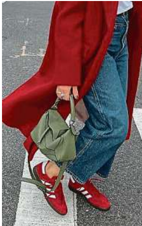
Street kousky, které se často staly virálními na internetu.