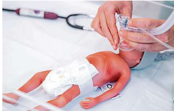
Téměř miniaturní figurína předčasně narozeného dítěte umožňuje zdravotníkům bezpečný nácvik kritických situací. 2x NEDOKLUBKO

Co když jste zdravotník, který musí oživovat předčasně narozené dítě? Trénink na dospělou Andulu vám moc nepomůže. Děti, které se rodí o několik týdnů dříve, mají mnohem jemnější tělíčko. Lékaři a sestry ve známé porodnici