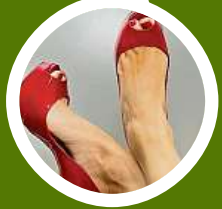
Boty s otevřenou špičkou. Ty letos oslnily módní mola. PINTEREST