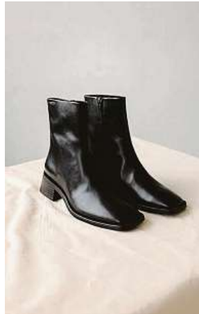
Kožené boty, které jsou oblíbené napříč generacemi.