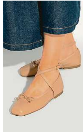
Chvilku byly out, ale už jsou zase in. Tak se dají popsat baleríny.