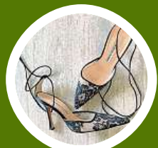
Vrací se boty na podpatku s tkaničkami.