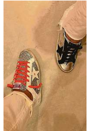
Designérské tenisky Hi Star od Golden Goose 4x PINTEREST