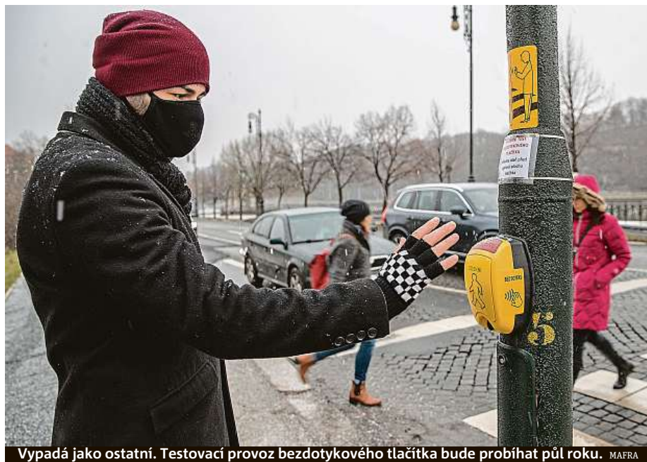
Vypadá jako ostatní. Testovací provoz bezdotykového tlačítka bude probíhat půl roku.