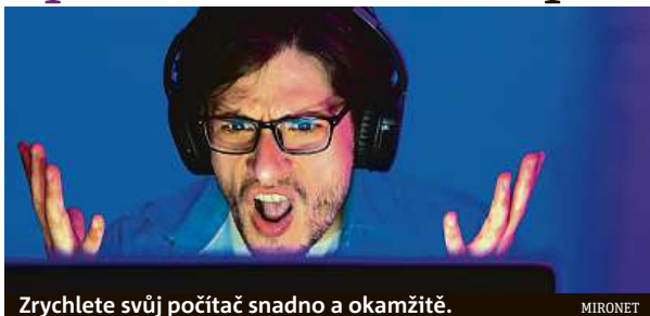
Zrychlete svůj počítač snadno a okamžitě.

A co v tomto případě znamená rychlý? Představme si to na konkrétním produktu, napří-