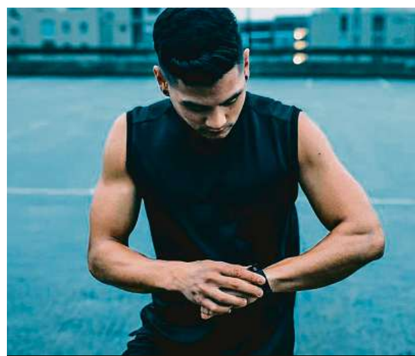
Garmin nabízí spolehlivé sportovní chytré hodinky.

Dámské hodinky Garmin Fenix5S Plus jsou tedy naprosto perfektním sportovním i módním doplňkem z řady chytré nositelné elektroniky. Neváhejte tedy. Zamířte do internetového obchodu Mironet.cz a pořídte si hodinky Garmin Fenix5S Plus v růžovo-bílé barvě za 24 724 korun.