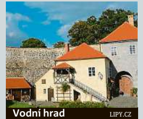
Vodní hrad LIPY.CZ

Vodní hrad Lipý, který je jednou z nejčinnějších památek České Lípy, si budou moci zájemci prohlédnout alespoň virtuálně. Jde o torzo hradu. Nejčinnější částí je gotický most. Patří k nejstarším památkám svého druhu v celém Libereckém kraji. Prohlídka se uskuteční živě streamována na facebookovém profilu městské organizace Kultura Česká Lípa ve středu od 13 hodin.