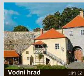
Vodní hrad LIPY.CZ

Vodní hrad Lipý, který je jednou z nejceněnějších památek České Lípy, si budou moci zájemci prohlédnout alespoň virtuálně. Jde o torzo hradu. Nejcenější částí je gotický most. Patří k nejstarším památkám svého druhu v celém Libereckém kraji. Prohlídka se uskuteční živě streamována na facebookovém profilu městské organizace Kultura Česká Lípa ve středu od 13 hodin.