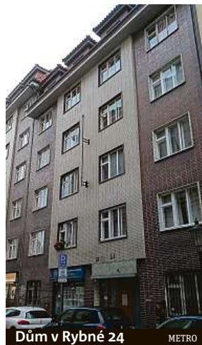
Dům v Rybné 24 METRO

Nyní web Jiříkovy kuchyně nefunguje, nicméně dříve, než ho Webnode zablokoval,