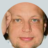
Martin Irein Nemám. Na mě se prý žádná nedala vymyslet.