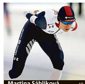
Martina Sáblíková.

Česká rojnasobná olympijská šampionka přišla těsně o cenný kov i v pátek v závodu na 1500 metrů, v němž byla pátá 21 setin od stupňů vítězů. „Jsem zklamaná, jinak to nemůžu hodnotit. Do Heerenveenu jsem si přijela