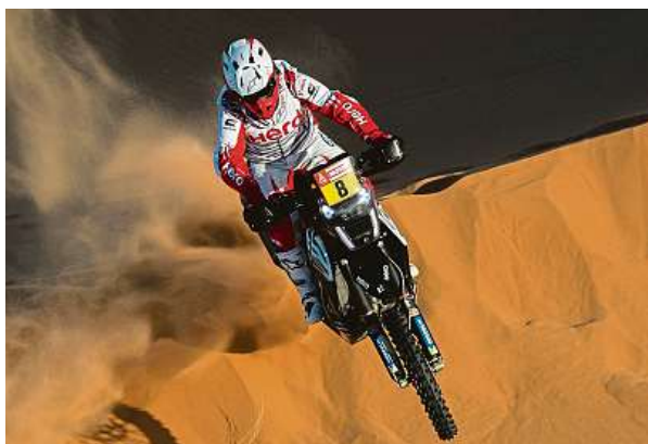
Portugalec Paulo Goncalves podlehl po pádu zraněním.

Celá sedmá etapa byla smrtí Portugalce poznamenána.