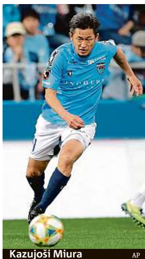
Kazuhoši Miura

Japonský fotbalový útočník Kazuhoši Miura se chystá na svou 35. profesionální sezonu. Miura, který na konci února oslaví 53. narozeniny, prodloužil smlouvu s nováčkem japonské nejvyšší soutěže Jokohamou, kde hraje od roku 2005. V minulé sezoně Miura nastoupil pouze do tří ligových duelů, celkem za Jokohamu odehrál 266 zápasů a vstřelil 28 gólů. Dříve působil v Santosu, Janově, Zářebu či Sydney. Za japonskou reprezentaci si připsal 89 utkání a 55 branek. Před třemi lety překonal rekord Angličana Stanleyho Matthewse, stal se nejstarším hráčem v historii profesionálních soutěží. ČTK