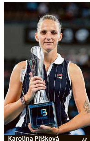
Karolína Plíšková

Kromě ní se z triumfu během víkendu radovaly také další tři její krajanky. V Brisbane uspěla také světová deblová jednička Barbora Strýcová. Se Sie Šu-wej z Tchaj-wanu zdolaly ve finále nejvyšše nasazený pár, domácí Ashleigh Bartyovou a Nizozemku Kiki Bertensovou po setech 3:6, 7:6 a 10:8.