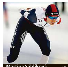
Martina Sáblíková.

Česká rojnasobná olympijská šampionka přišla těsně o cenný kov i v pátek v závodu na 1500 metrů, v němž byla pátá 21 setin od stupňů vítězů. „Jsem zklamaná, jinak to nemůžu hodnotit. Do Heerenveenu jsem si přijela