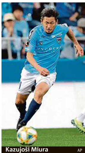
Kazujoši Miura

Japonský fotbalový útočník Kazujoši Miura se chystá na svou 35. profesionální sezonu. Miura, který na konci února oslaví 53. narozeniny, prodloužil smlouvu s nováčkem japonské nejvyšší soutěže Jokohamou, kde hraje od roku 2005. V minulé sezoně Miura nastoupil pouze do tří ligových duelů, celkem za Jokohamu odehrál 266 zápasů a vstřelil 28 gólů. Dříve působil v Santosu, Janově, Záhřebu či Sydney. Za japonskou reprezentaci si připsal 89 utkání a 55 branek. Před třemi lety překonal rekord Angličana Stanleyho Matthewse, stal se nejstarším hráčem v historii profesionálních soutěží. ČTK