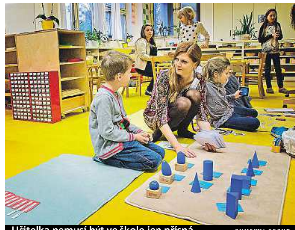
Učitelka nemusí být ve škole jen přísná.

Důraz na individuální přístup je kladen i v montessoriovských školách. „Pedagogové nejsou pro děti autoritativními osobami, ale spíše partnery, kteří jim pomáhají metodou názorných pokusů a mnohdy i chyb poznávat