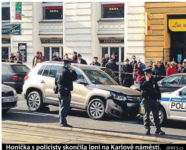
Honička s policisty skončila loni na Karlově náměstí. IDNES.cz

Odmítl ale tvrzení obžaloby, že se ulicemi Prahy řtil rychlostí 150 kilometrů v hodině a že ohrožoval chodce i další řidiče. „Prahu neznám, ale myslím, že není reálné, abych v provozu řídil takovou rychlostí, která je mi kladena za vinu... Při čtení obžaloby