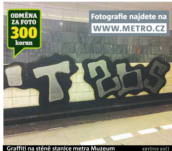
Graffiti na stěně stanice metra Muzeum