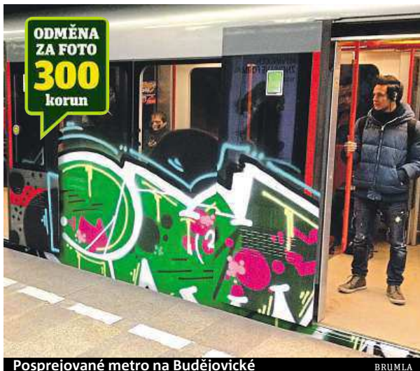
Posprejované metro na Budějovické

Dopravní podnik teď zjišťuje, jak se vandalové do stanice vůbec dostali – existuje totiž důvodné podezření, že pachatelé překonali zabezpečení metra a na místo pronikli systémem hlavního větrání. Pachatelé navíc dokázali, že se ve stanici solidně vyznají. Stříbrnočerný nápis nastříkali na zeď v místě, které je mimo dosah bezpečnostních kamer. „Graffiti vzniklo na stěně za kolejíštěm u druhé koleje, kde je mimo záběrový úhel kamer pro tuto kolej, za-