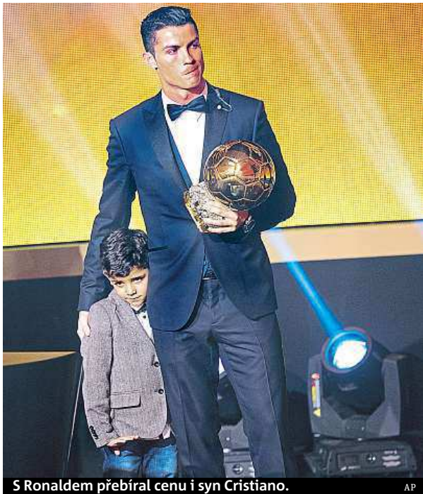
S Ronaldem přebíral cenu i syn Cristiano.

Nejdříve byla vyhlášena nejlepší jedenáctka, ve které pochopitelně figurovali také