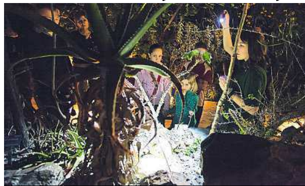
Exotiku můžete zažít každý pátek.

Až do konce března se jednou týdně rozzáří exotická džungle botanické zahrady. Od 18 hodin můžete týden co týden zažít skleník Fata Morgana jinak. V exotickém prostředí zní každý pátek koncert sboru tropických žabek. Atmosféru dokresluje i romantické šumění nasvíceného vodopádu. Ale pozor, o exotiku uprostřed zimy je zájem. Rezervace na čísle 603 582 191 nebo na mailu eva.vitova@botanicka.cz je proto nutná. MAH