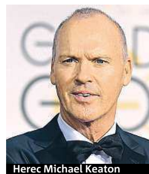
Herec Michael Keaton