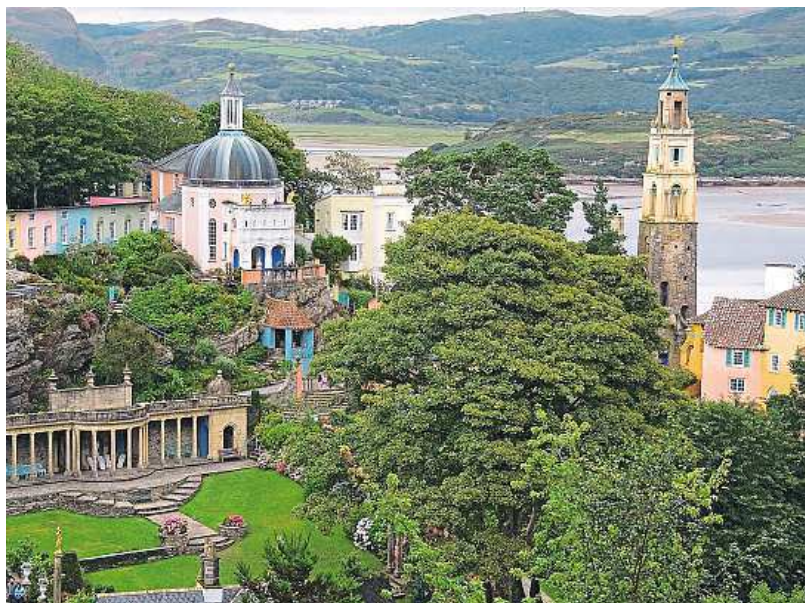
Portmeirion has a beautiful position on a hill overlooking the coast.