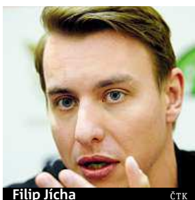
Filip Jícha

„Každé měření s takovými soupeři, jako je Švédsko, Francie či Island, nás posune dál. Kluci nasbírají zkušenosti. Tohle je důležitý faktor mistrovství,“ uvedl Kubeš.