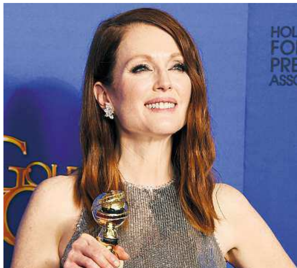
Nejlepší herečka filmového dramatu: J. Mooreová