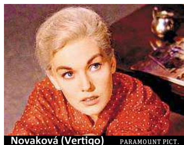
Novaková (Vertigo)

Pozvání na Mezinárodní filmový festival Praha – Febiofest, jehož 22. ročník se uskuteční od 19. do 27. března v multikině Cinestar Anděl, přijala americká herečka Kim Novaková, známá nejen ze slavného Hitchcockova thrilleru Vertigo. Pro Kim Novakovou bude Febiofest první oficiální návštěvou Česka. Hrála ve filmech patřících ke klenotům Hollywoodu po boku Jamese Stewarta, Franka Sinatry, Kirka Douglase, Williama Holdena nebo Jacka Lemmona. Některé z nich jako Vertigo, Piknik nebo Uprostřed noci festival uvede v rámci retrospektivy Pocta Kim Novakové. ČTK