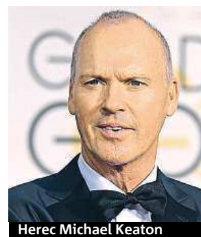
Herec Michael Keaton