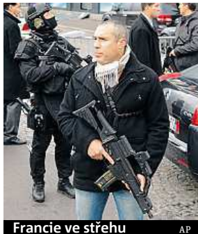
Francie ve střehu

Francie mobilizovala kvůli hrozbě dalších útoků přes pět tisíc policistů a deset tisíc vojáků na ochranu židovských škol, synagog a dalších citlivých míst v zemi. Policie také dál pátrá po komplici teroristů Amedyho Coulibalyho a bratrů Chérifa a Saída Kouachiových, kteří zastřelili několik redaktorů satirického časopisu Charlie Hebdo. V neděli jí kdosi zaslal na-