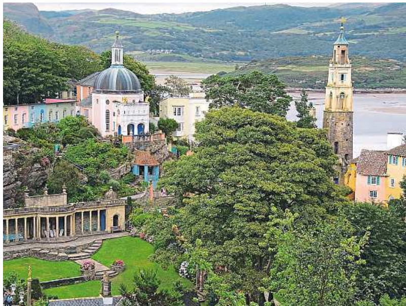
Portmeirion has a beautiful position on a hill overlooking the coast.