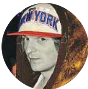
Tomas Heladero Větší strach mám ze Zemana, který kuje pikle s Putinem.