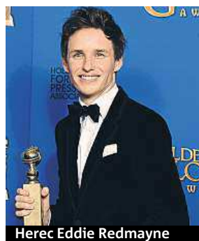
Herec Eddie Redmayne