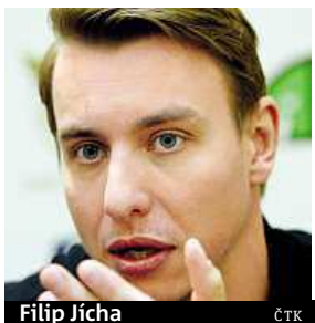
Filip Jícha