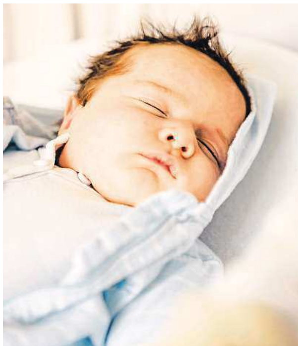
Děti, které se prospí, mají lepší paměť.

Děti, které se prospaly, dokázaly napodobit výrazně více dějů než děti z kontrolní skupiny. Úplně nejhůře na tom byly děti, které zůstaly po první ukázkě vzhůru. Ty si totiž podle odborné studie vůbec nepamatovaly, co jim ženy předtím s loutkami předváděly. ČTK