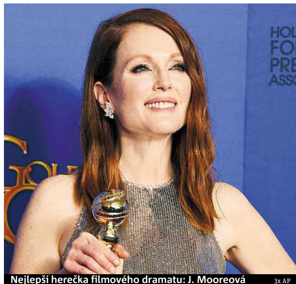
Nejlepší herečka filmového dramatu: J. Mooreová