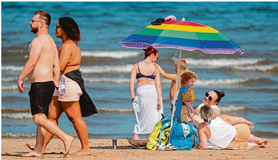
Bezstarostné dny u moře se mohou nepříjemně prodažit.

„Vyšší ceny logicky znamenají vyšší ztráty v případě nepojištěné cesty, kterou musí klient zrušit. Zatímco v cestov-