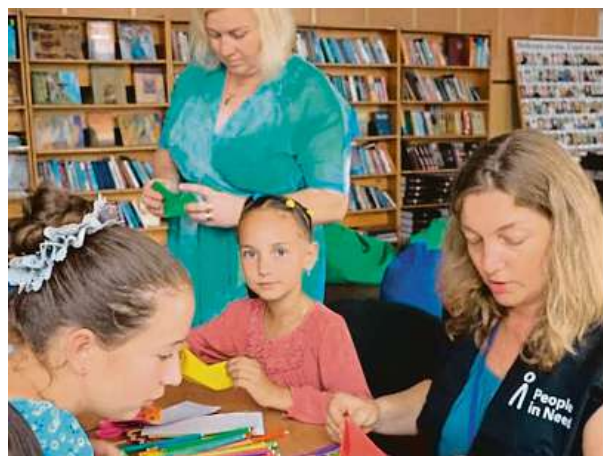
Výuka ukrajinských školáků