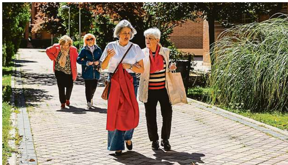
Místo intenzivních tréninků jsou vhodnější procházky.