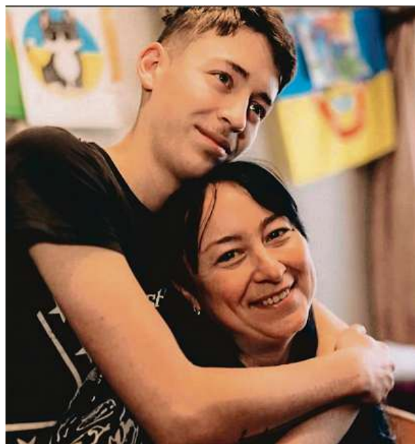
Pomoc ukrajinským dětem