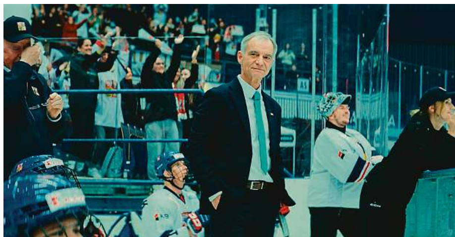
Parahokejový zápas nabral obrátky.