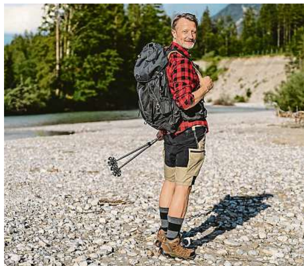
Pohyb je jednou z klíčových rolí v otázce dlouhověkosti.