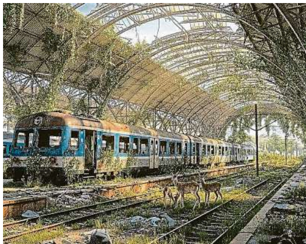
Neuvěřitelná díla, takhle Prahu určitě nepoznáte! Vídea najdete na Facebooku pod jménem Václav Krejčí, na Instagramu pod profilem ven_da. Ano, se dvěma podtržítka.