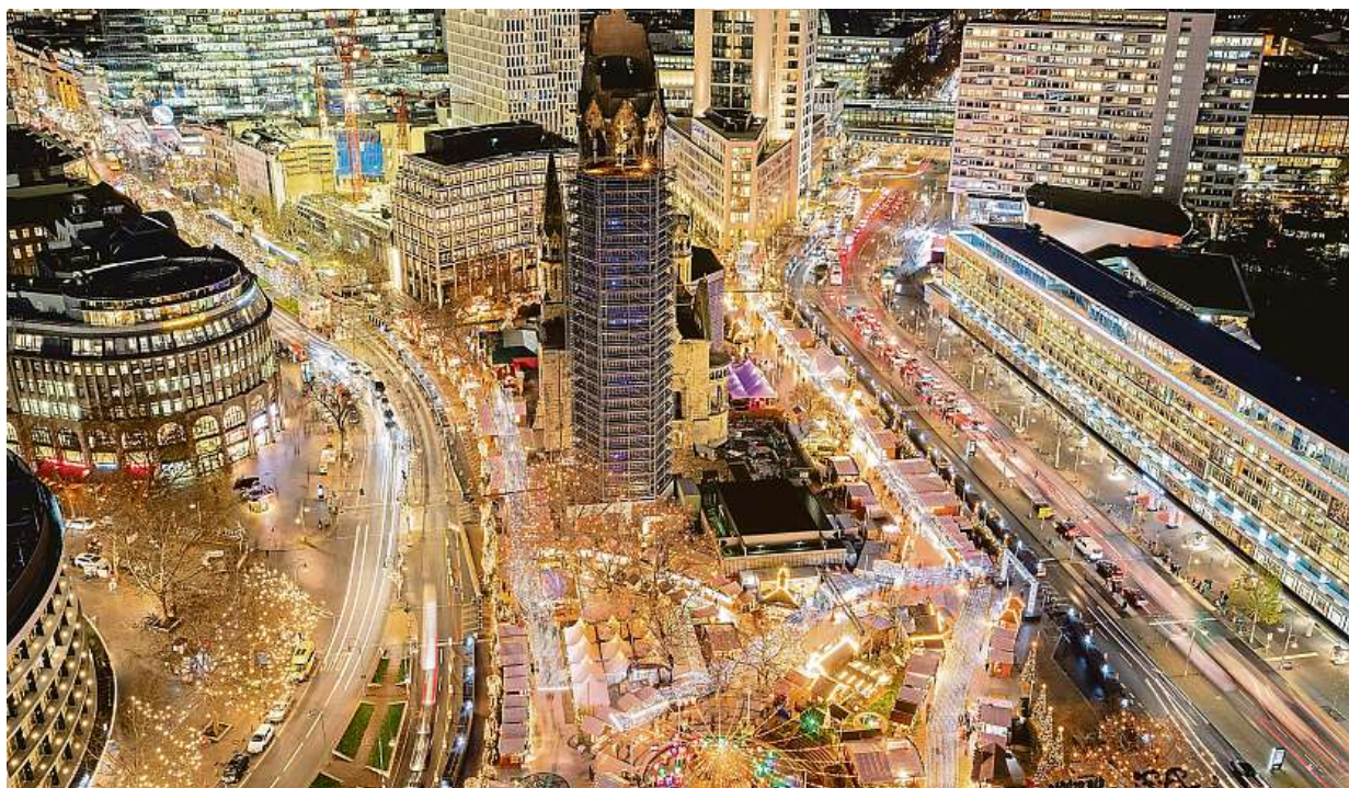
Berlínské vánoční trhy potrvají do 26. prosince.

Několik stánků je také za rohem na náplavce. V těchto místech jsme skoro sami a pohodová neuspěchaná atmosféra se šlágrů Franka Sinatry