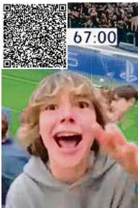
Co je 67, či six seven? Naskenujte QR kód a přečtete si na webu.

Zahraniční osobnosti, o nichž ve vyhledávání na Googlu letos vzrostl zájem nejvíce, je jednoznačně zpěvačka Dua Lipa, jejíž pražské vystoupení a nečekaný duet s Ewou Farnou zbořily český internet. Spojení mezinárodních hvězd a Česka se nese celým žebříčkem, konkrétně třeba v případě Dakoty Johnson,