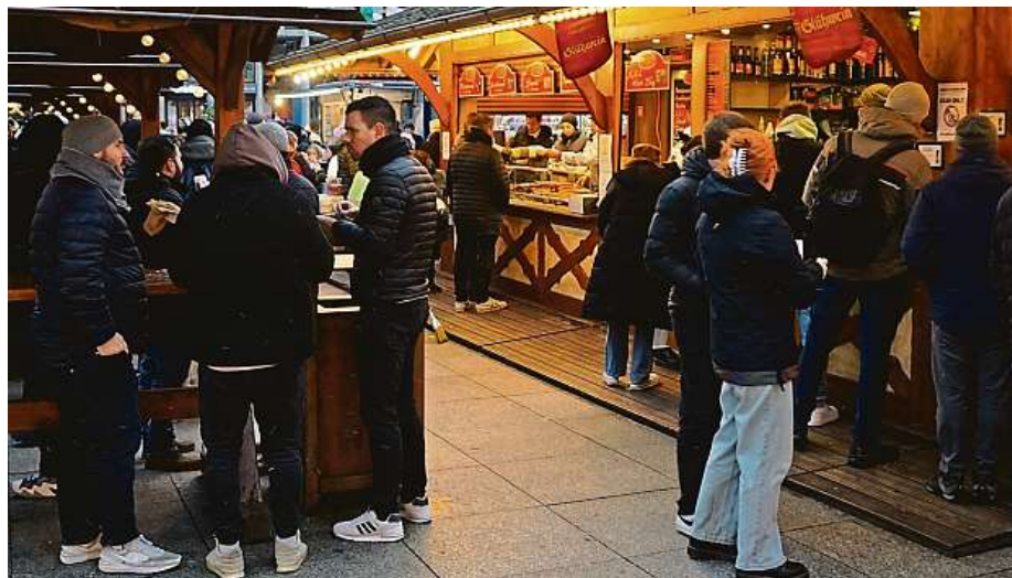
Dáte si svařák, nebo punč?