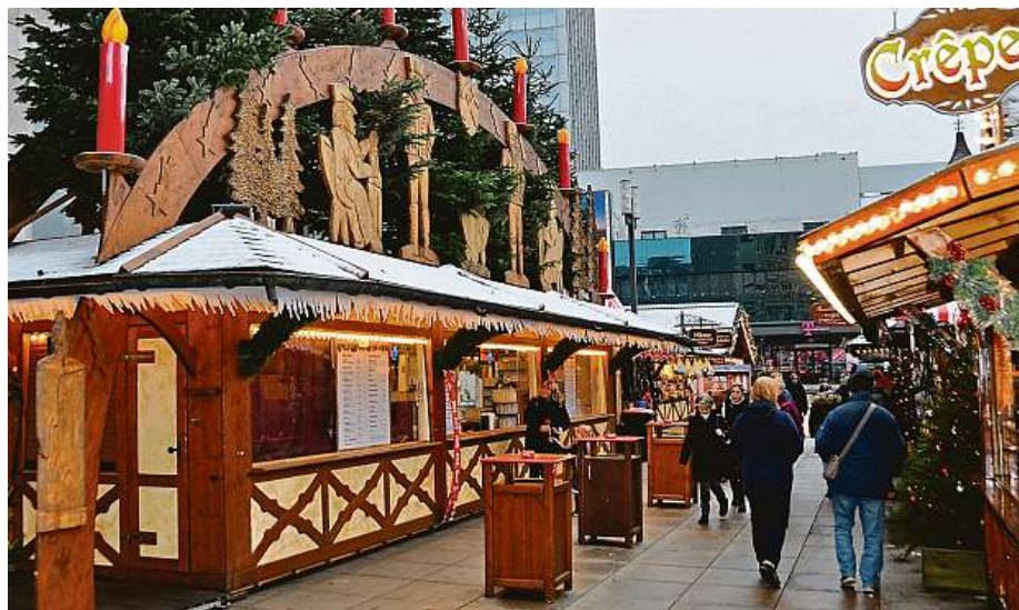
Pochutnáte si na bratwurstu, či kebabu?